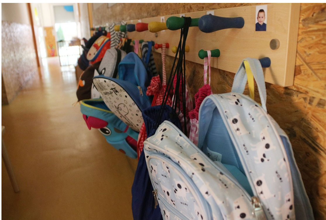
Una motxilla a una llar d'infants | ACN

Les sol·licituds es podran presentar fins al 21 de març