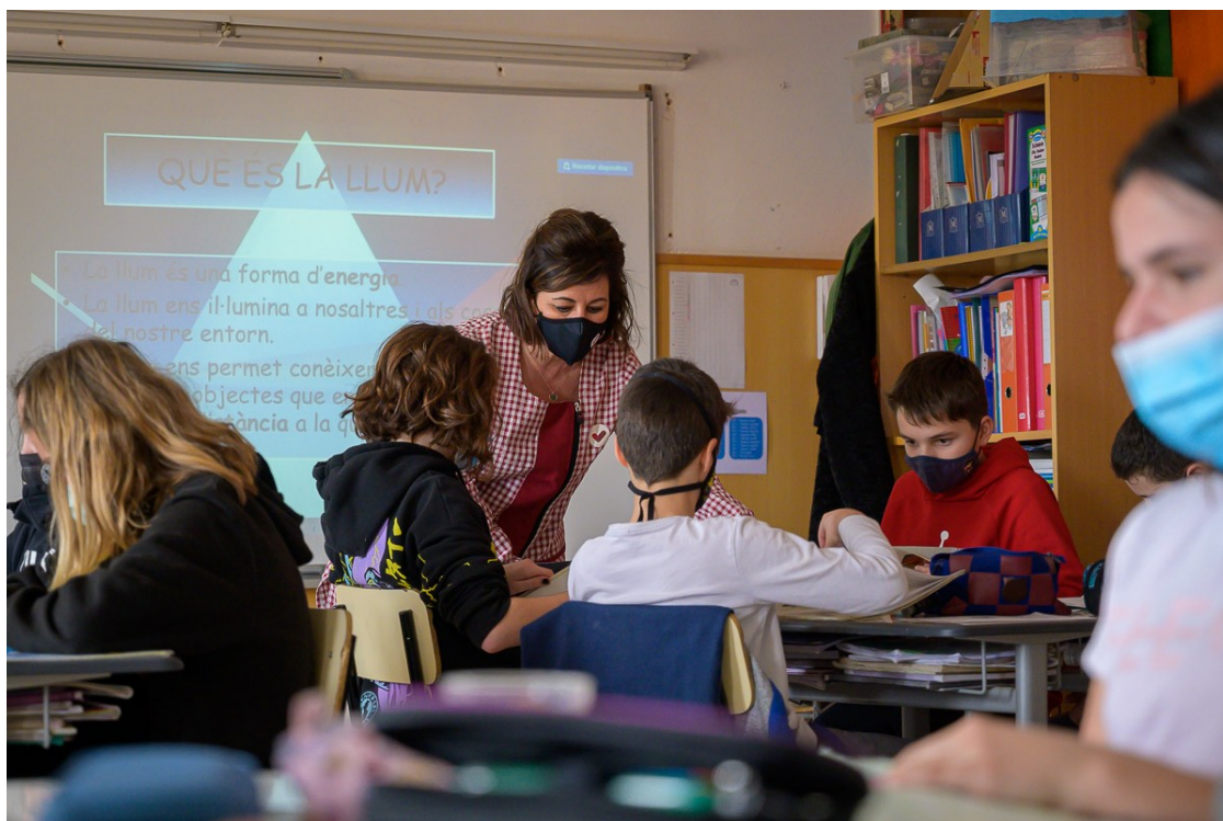
Escola Vedruna de Tona | Josep M Montaner

La mesura s'aplicarà a partir del curs vinent a P3 al 99% dels grups públics i al 73% dels grups concertats, i s'anirà ampliant a la resta de cursos en els propers anys