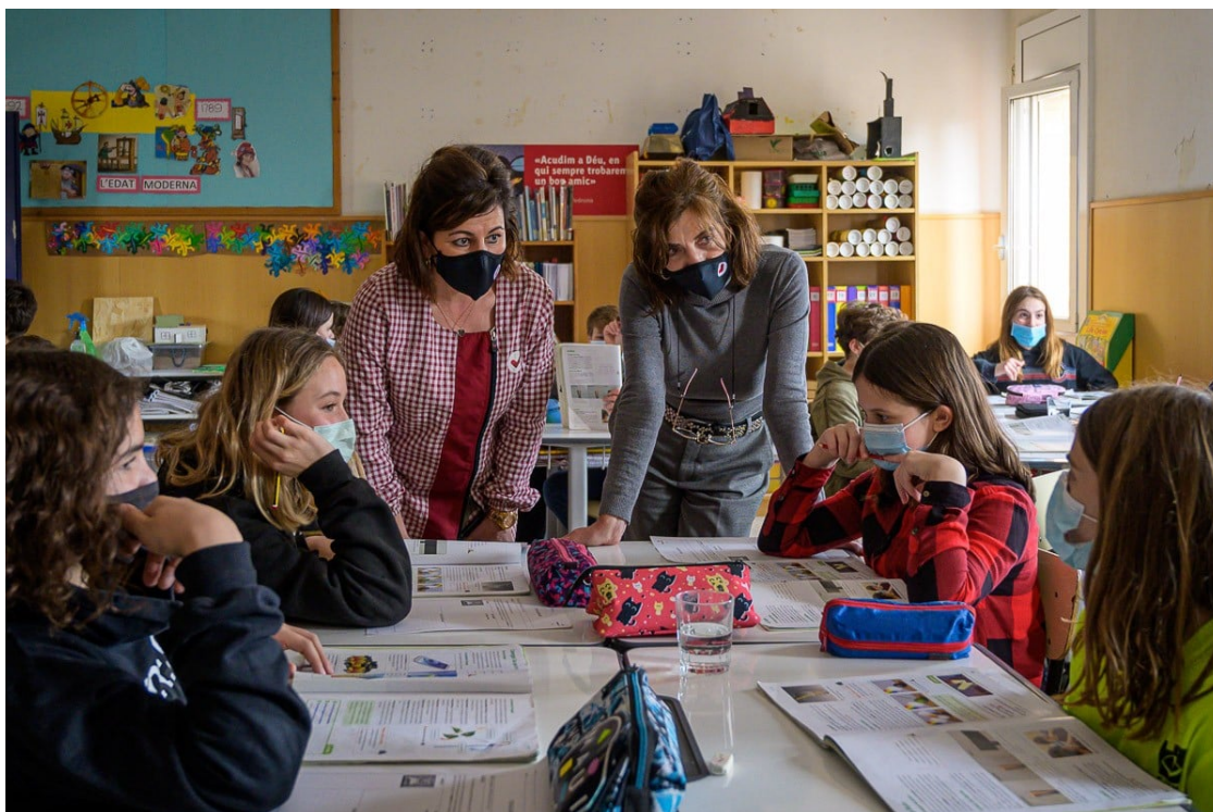
Alumnes d'una escola fent classe | Josep M Montaner

Infantil i primària farà horari compactat de 9 a 13 hores durant el setembre i els instituts iniciaran les classes el 7 de setembre amb jornada habitual