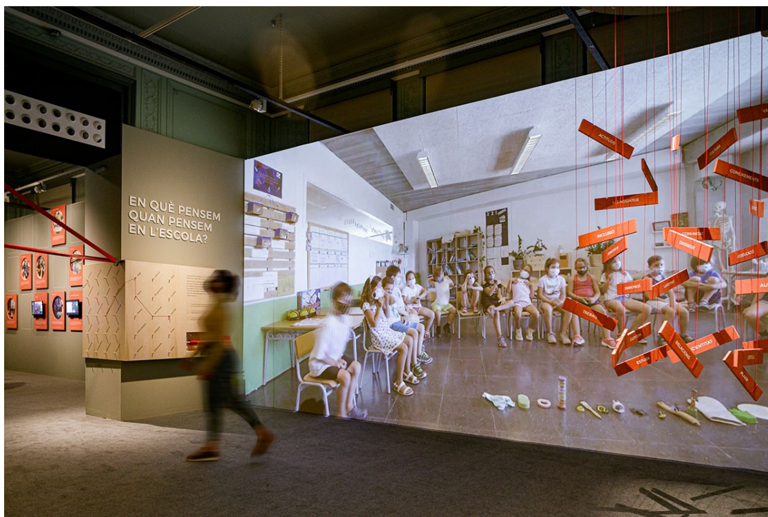
Unes plaques solars en una teulada | Generalitat de Catalunya

Una exposició al Palau Robert proposa pensar l'escola pública des de diferents perspectives