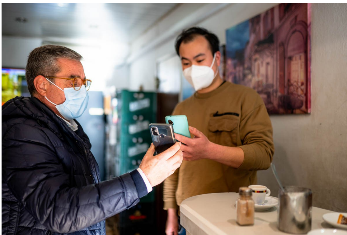
Validació del certificat Covid a l'entrada d'una cafeteria de Barcelona.