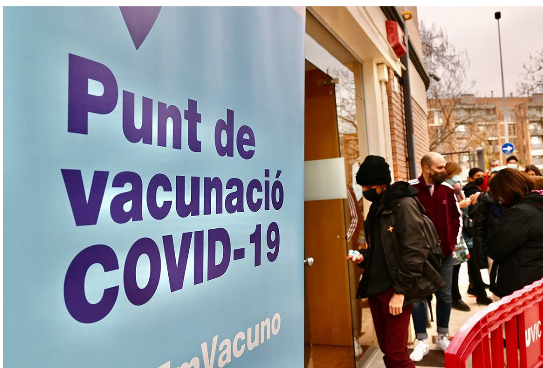
Un punt de vacunació a Vic | Josep M. Montaner

Catalunya rebrà dilluns vinent les primeres 234.000 dosis de Pfizer, que serà la vacuna que s'administrarà a nens i nenes