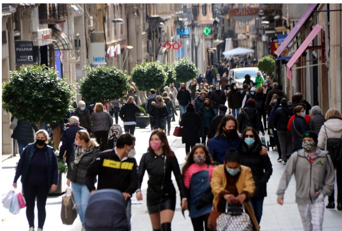
Veïns al carrer de Llovera de Reus

La secretària de Salut Pública, Carmen Cabezas, demana "ventilar sovint" i utilitzar la mascareta "sempre que es pugui" de cara a les festes