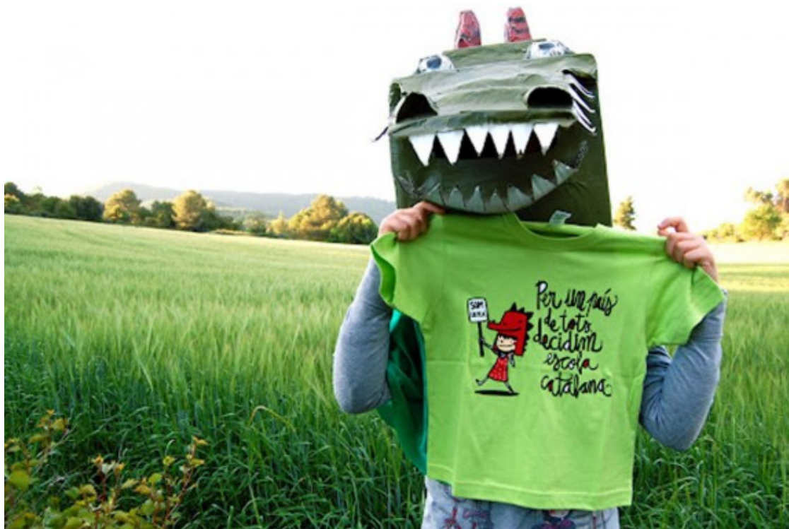
Samarreta de la campanya Som Escola il·lustrada per Joan Turu.

- Doncs que no m'agradaria gens que la gent es pensés que ens hem aprofitat de la proximitat amb el Dia Internacional per a l'Eliminació de la Violència envers les Dones per treure més rèdit del llibre. Per a mi seria impensable! Si surt a la llum ara és perquè comença la campanya de Nadal.