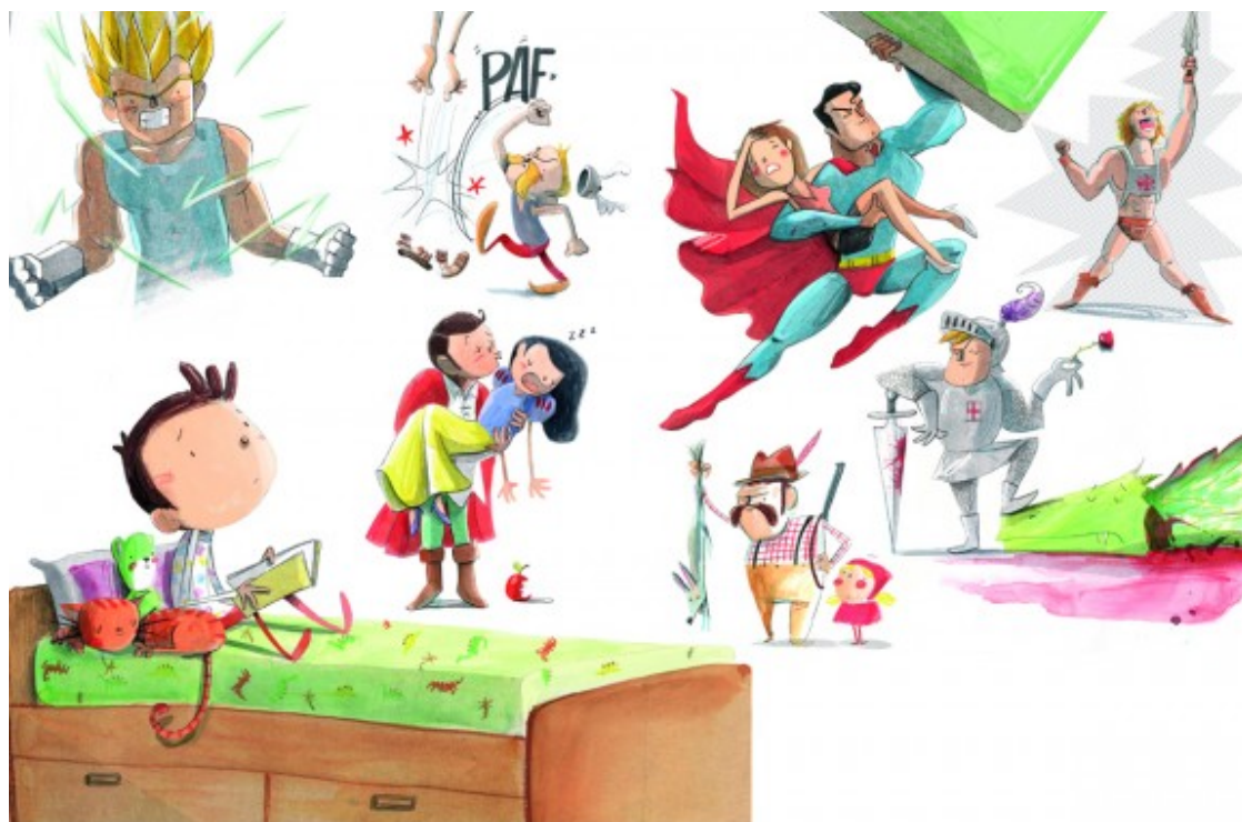
Il·lustració del conte «Els homes plorem», de Joan Turu. Foto: Joan Turu

- Sí. I mira que a casa mai li hem dit que no plorés; al contrari! De fet, la meua filla no té cap problema per plorar.