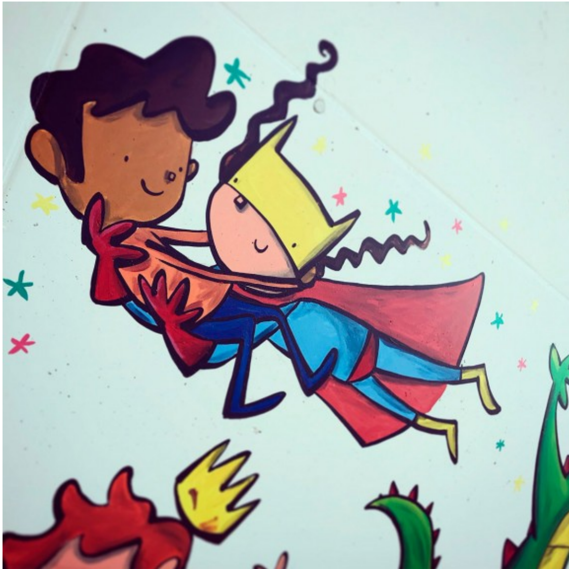
Una il·lustració de Joan Turu.

- I professionalment, se'n va ressentir la seva creativitat?