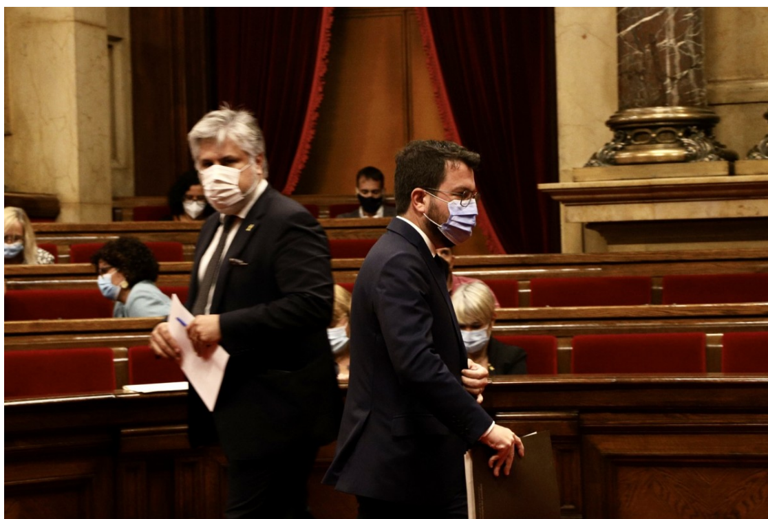
El president de la Generalitat, Pere Aragonès, i el president del grup parlamentari de Junts, Albert Batet, al Parlament

El diàleg amb l'Estat promogut per ERC, l'ampliació de l'aeroport defensada per Junts i el calendari per a l'autodeterminació proposat per la CUP monopolitzen el xoc al Parlament