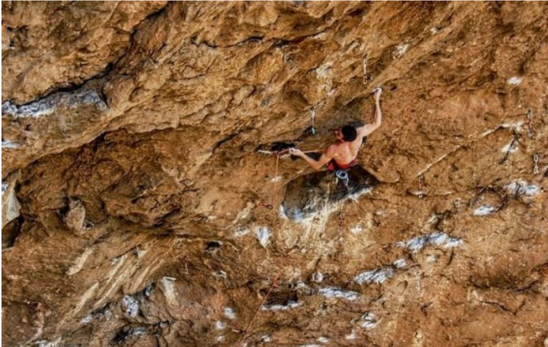
Un escalador, a la paret de l'Os.

L'ens provincial no vol que Sant Llorenç es converteixi en un segon cas com el del congost de Mont-rebei ( https://www.naciodigital.cat/lleida/noticia/44824/montrebei-torna-rebre-turistes-deu-mesos-despres ) , afectat per despreniments ( https://www.naciodigital.cat/lleida/noticia/44824/montrebei-torna-rebre-turistes-deu-mesos-despres ) que han obligat a tancar l'espai natural durant gairebé un any. Aquesta voluntat i els treballs per fer-la real ha topat amb l'oposició dels escaladors, que creuen que la retirada de roques de la muntanya s'ha fet de manera ?improvisada i exagerada?. ( https://www.naciodigital.cat/lleida/noticia/44928/150-persones-reclamen-laturada-de-les-obres-per-evitar-esllavissades- )