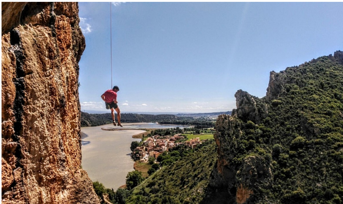
Un escalador penjat a la paret de l'Os

La paret de l'Os de Sant Llorenç de Montgai s'ha convertit en una icona de l'escalada i un actiu turístic ara reivindicat pels escaladors, que temen una afectació irreparable a causa de la retirada de roques per seguretat