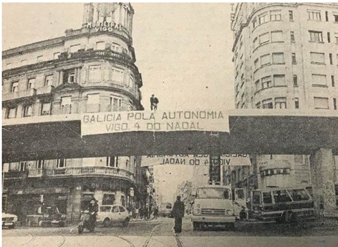
Pancarta als carrers de Vigo convocant la manifestació del 4 de desembre de 1977 en defensa de l'autonomia gallega

conjunt de l'Estat espanyol, ja que aquell mateix dia també es van celebrar grans mobilitzacions en favor de l'autogovern a Andalusia, una circumstància que no va agradar gens al poder central madrileny.