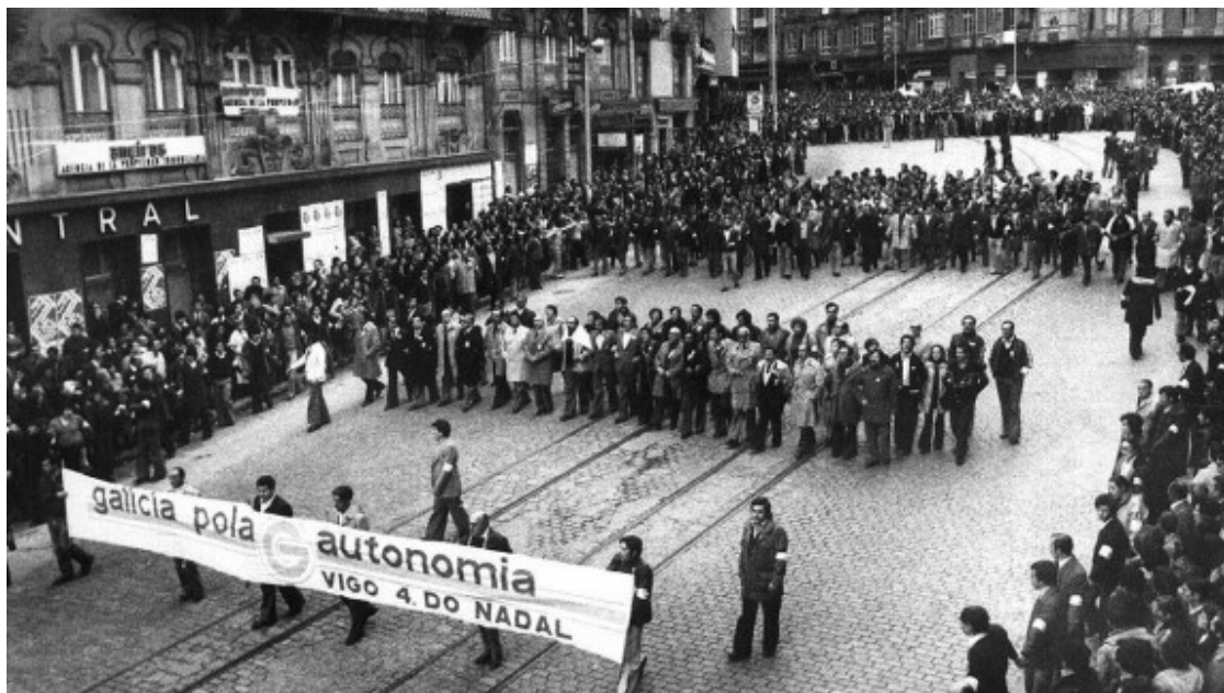
Capçalera de la històrica manifestació del 4 de desembre de 1977 a Vigo que va aplegar 300.000 persones en defensa de l'autonomia gallega

Conscients de l'impacte que el futbol tenia en la societat gallega i en la del conjunt de l'Estat espanyol , els promotors de la mobilització del 4 de desembre de 1977 no van voler que la jornada reivindicativa s'acabés amb la fi de la manifestació i van planificar una acció a l'estadi de Balaídos on durant la tarda d'aquell diumenge el Celta havia d'enfrontar-se al Granada andalús en un partit de lliga de la segona divisió estatal.