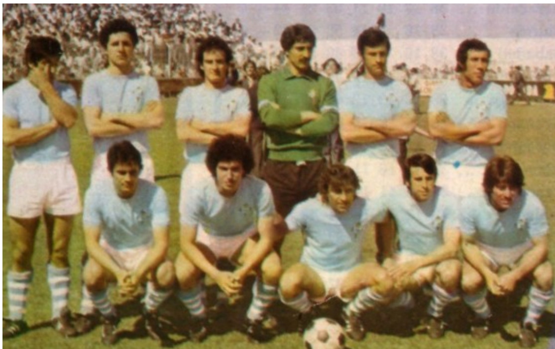
Alineació del Celta de la temporada 1977-78 en què l'equip de Vigo va aconseguir l'ascens a primera divisió

Malgrat que el resultat era el menys important, el Celta va guanyar el partit per 2-0 encoratjat per un públic emocionat pels actes galleguistes que s'havien viscut durant el prelude del matx. Pels organitzadors de les mobilitzacions, el que s'havia viscut a Balaídos era tant o més important que el volum de manifestants que havien omplert els carrers de Vigo i de les principals ciutats de la Nació del Breogán.