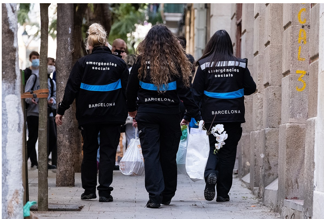
Treballadores d'emergències socials en un desnonament al barri del Raval

L'Ajuntament no ha complert el compromís adquirit el 2018 per evitar que els treballadors hagin d'auxiliar la comitiva judicial