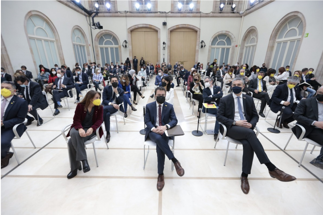
L'auditori del Parlament, durant el debat d'investidura.

El relleu en el lideratge a bona part dels partits i els efectes de la repressió en el camp independentista atorguen camp per córrer a dirigents amb projecció al Parlament i el Govern