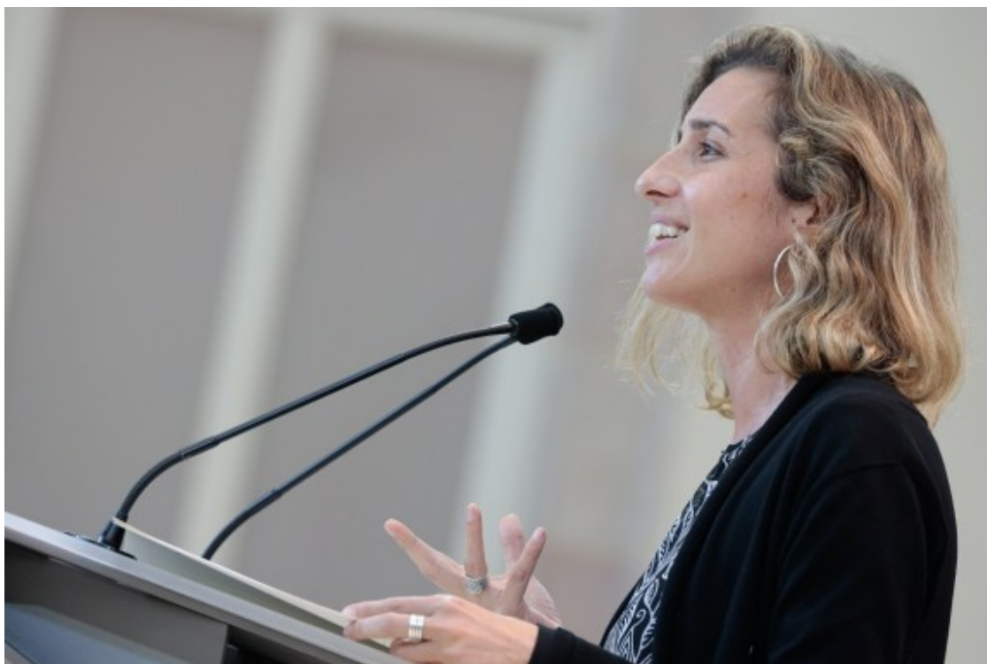
Laia Estrada, diputada de la CUP.

Laia Estrada (Tarragona, 1982) és una de les diputades del grup parlamentari de la CUP que tindrà més recorregut al faristol del Parlament. Ja va ser la cara de la coalició en algun dels debats televisius del 14-F -encapçalava la llista per Tarragona- i també va disposar de protagonisme en les rèpliques del debat d'investidura d'Aragonès ( https://www.naciodigital.cat/noticia/218040/investidura-aragones-aire-quins-esculls-hauran-superar-junts-erc ) . Ambientòloga de formació i amb experiència a la docència -és professora de secundària-, coneix al detall la política municipal, per l'experiència en la tasca de regidora a l'Ajuntament de Tarragona. Des del consistori, va contribuir de forma decisiva a destapar el cas Inipro, que va esquitjar l'exalcalde socialista Josep Fèlix Ballesteros, altres integrants del seu govern i alts càrrecs de l'Ajuntament. De pare sindicalista i amb implicació en moviments de defensa de la salut pública, destaca per la bona oratòria. Tindrà un paper actiu en els debats parlamentaris, en una legislatura en què la CUP aspira a tenir un rol protagonista.