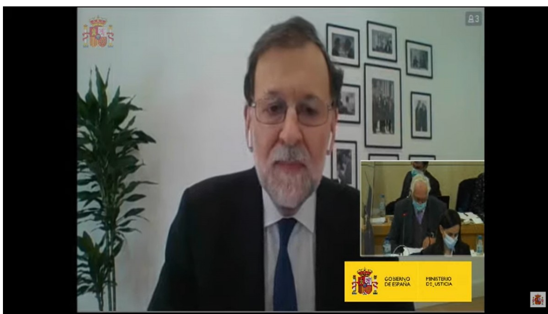
Mariano Rajoy durant el judici per la caixa B del PP | ND

L'expresident del govern espanyol endureix el to i qualifica de "delirants" les acusacions de Bárcenas