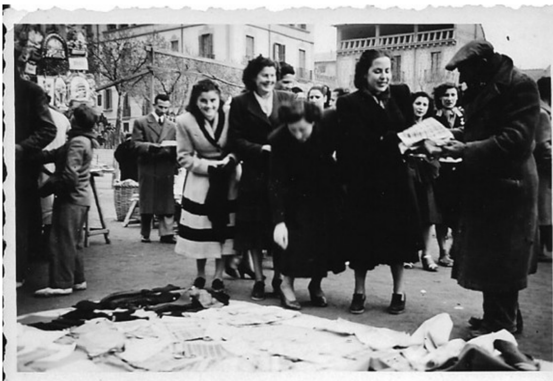
Imatge inèdita del Gravat Crosta a Manlleu, el 1953.

Tal com ja s'ha apuntat més amunt, els dies de mercat instal·lava la seva parada de roba a sota la cúpula de l'Ajuntament, a la Plaça Major, on alternava la venda de mocadors farcells, trossos de roba i mitjons de llana, amb el dibuix al carbó i l'aquarel·la. Però també acostumava a muntar la parada a altres poblacions, com Manlleu, Torelló i Puigcerdà.