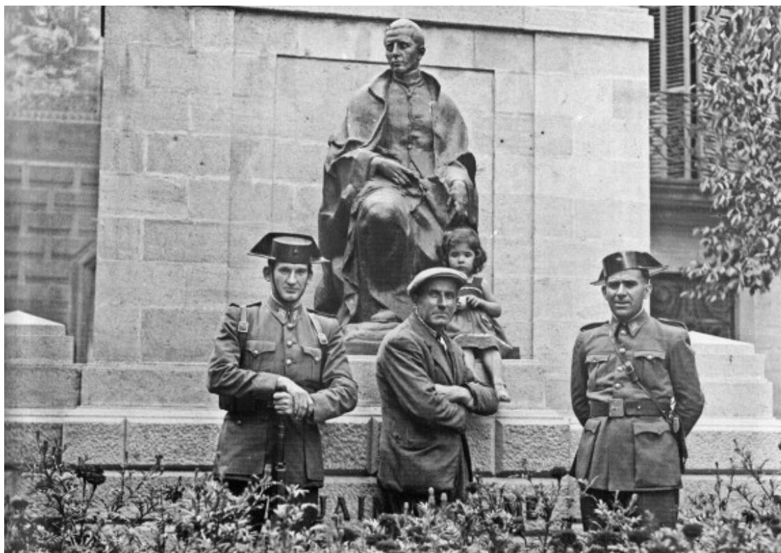
Gravat Crosta al Parc Jaume Balmes.

Molt aficionat a la fotografia, tenia alguna anècdota espectacular , com la que diuen que va protagonitzar a finals dels anys 40, amb motiu de la visita que Franco va fer a la ciutat. Es veu que es va enfilair dalt d'una escala de fusta a la Plaça de la Catedral, per tenir una millor visió del seguici oficial. Però en el moment de tirar la foto, en accionar el dispositiu del flaix provocat pel magnesi, es va produir una gran fumera que va alertar tots els serveis de seguretat que es cuidaven de la seguretat del Caudillo i els seus acompanyants. La intercessió de les autoritats locals li van evitar la garjola.