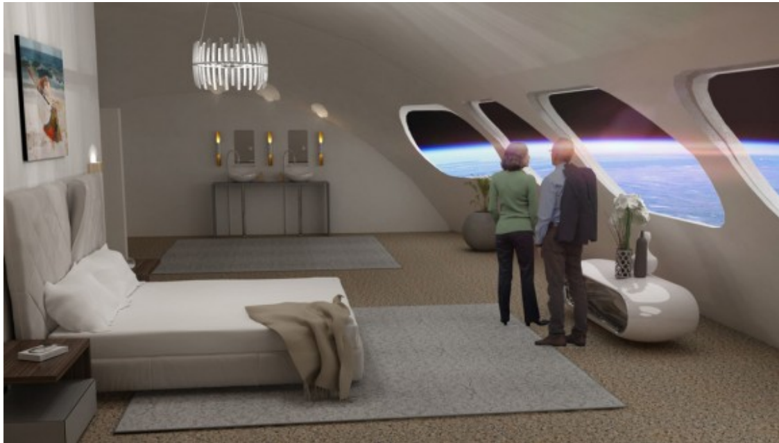
Una de les habitacions de luxe