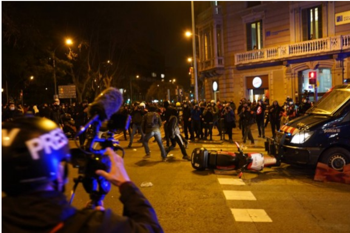
Aldarulls a Barcelona per l'empresonament de Pablo Hasél.