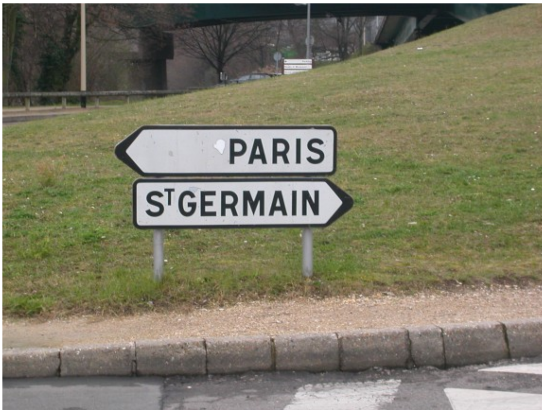
Senyals de trànsit a Chatou, a la perifèria de París, que són una metàfora de la divisió que va viure el PSG el 1972

Amb l'objectiu de fer palès el seu vincle tant amb París com amb Saint-Germain-en-Laye, aquest nou PSG de 1972 va dissenyar un escut, base del seu logotip actual, on s'hi representava la Torre Eiffel, emblema de París, i un bressol i una flor de lis en representació de Saint-Germain.