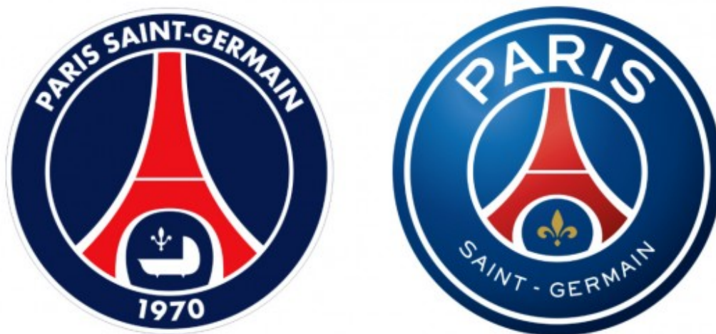
L'escut del PSG, abans i després de la reforma que en van fer els propietaris qatarians el 2013

Amb algun breu parèntesi, el bressol i la flor de lis havien estat sempre dos dels elements més identificatius del PSG fins que, el 2013, els seus nous propietaris qatarians van decidir remodelar-ne l'escut. Vist el resultat, l'objectiu del canvi era evident: accentuar el pes de la ciutat de París en el logotip. La reforma va comportar la desaparició del bressol reial de Lluís XIV però va suposar augmentar el protagonisme de la flor de lis borbònica que se situa als peus de la Torre Eiffel.