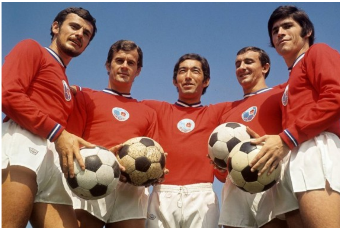
Diversos dels integrants del PSGFC durant la primera temporada de la seva existència, la 1970-71

L'aliança entre les dues entitats va provocar el naixement del Paris Saint-Germain Football Club, una denominació que conjuntava les ciutats d'on eren originaris els equips que l'havien promogut. Seguint amb aquesta lògica, el nou PSG va adoptar el Parc dels Prínceps, propietat de l'ajuntament de París, com a estadi i el Camp des Loges, a Saint-Germain-en-Laye, com a espai d'entrenament i formació. Els colors del nou club també van reflectir aquesta fusió incorporant el blanc de la samarreta de l'Stade Saint-Germainois al roig i al blau que identificaven la capital francesa.