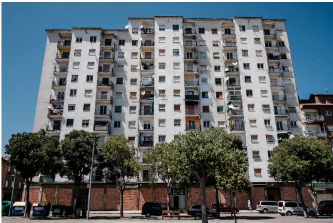
Pisos de Can Garcia.

El cas és que vaig començar a trepitjar les diferents escales dels pisos dels dos blocs gegantins de Can García, i a dipositar les octavetes a les nombroses bústies que hi havia a l'entrada de cada escala. Quan ja estava a punt d'acabar la feina al segon bloc, em vaig espantar molt quan va entrar un home que deuria viure en un dels pisos. Em va veure amb els papers a la mà, però no va dir res i va pujar escala amunt. Aleshores vaig decidir deixar de repartir els pocs papers que em quedaven, me'n vaig guardar un plec a sota la roba, aguantats pel cinturó, i em vaig dirigir a pas lleuger al lloc on havíem deixat el cotxe, davant les piscines.