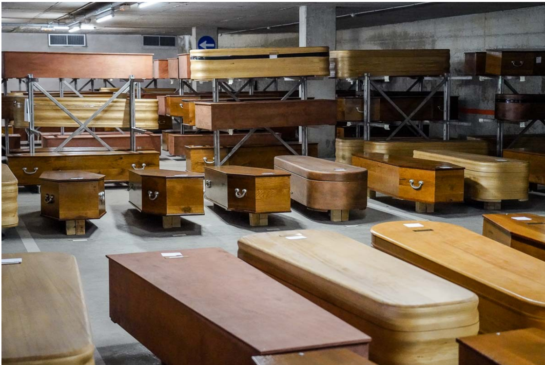
Tanatori de Collserola | Martí Urgell

L'increment de 14.300 és inferior al número de defuncions per Covid a causa de la reducció d'altres causes