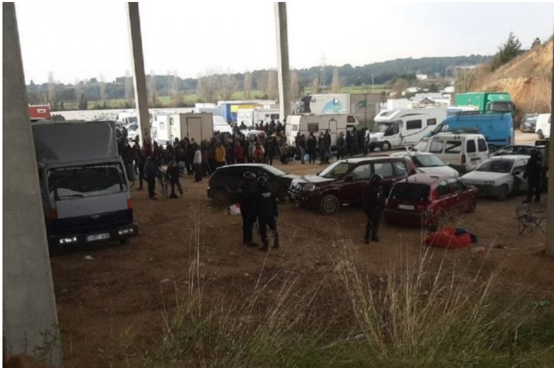
Desallotjament de la festa il·legal a Llinars.

En l'operatiu han participat prop d'una vintena de furgonetes de la policia catalana, juntament amb altres vehicles de Mossos i la policia local, un helicòpter i efectius del Servei d'Emergències Mèdiques (SEM).