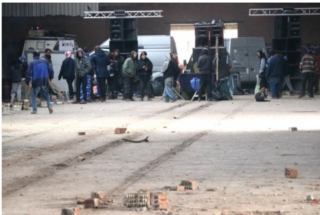
La «rave» de Llinars del Vallès, aquest matí.