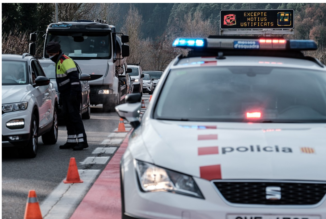
Control d'accés al sud de Ripoll

Les zones menys turístiques del Ripollès tenen les pitjors dades epidemiològiques i el risc de rebrot es va disparar molt abans del pont