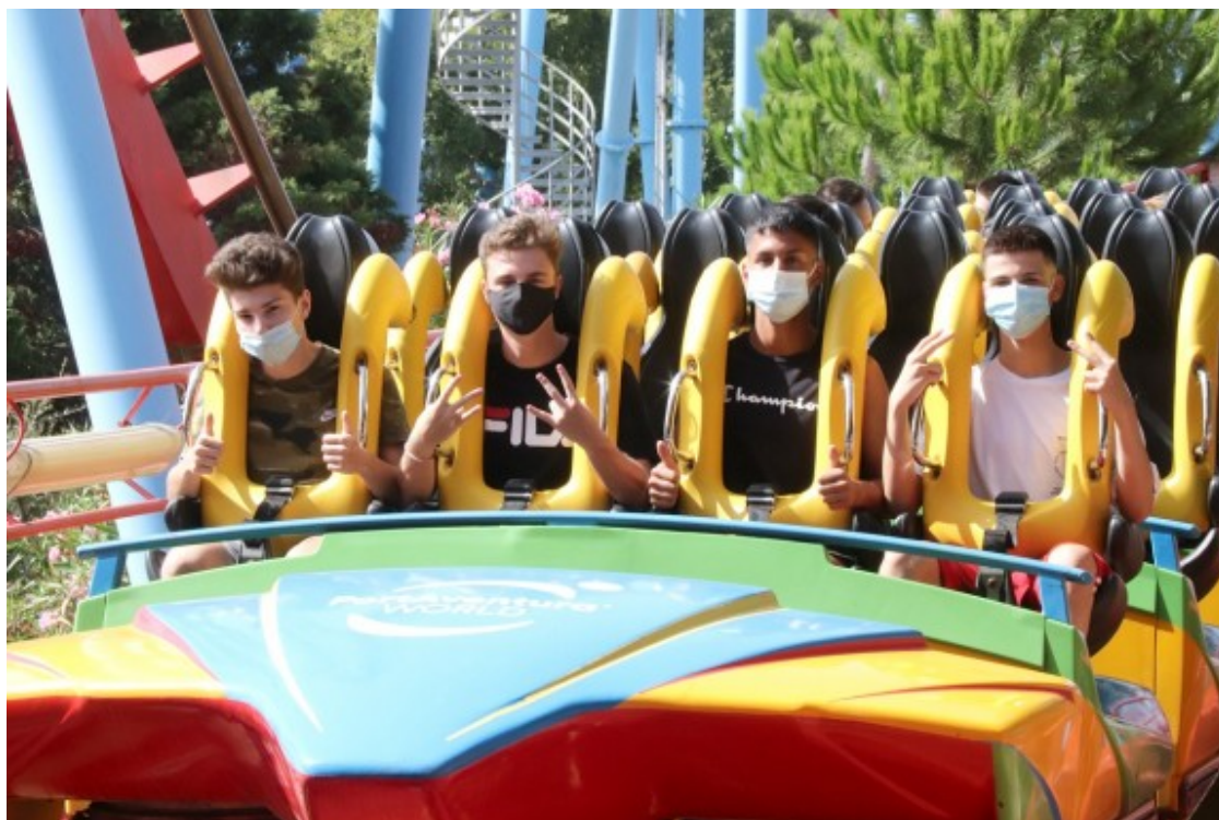
PortAventura estrena la nova normalitat.

- Perquè a nivell de la política o de l'economia, quan una cosa va bé i està de moda a l'estranger sempre es vol. Hi ha molts països que no tenen fàbrica de cotxes i que ho busquen, per exemple en el cas del Marroc a través de compensacions. Formava part també de l'esperit Pujol: Catalunya serà important.