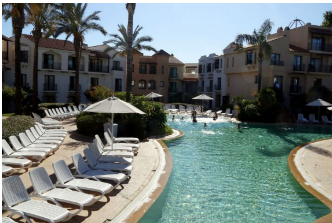
L'Hotel PortAventura, que forma part de la Vila Mediterrània.

- En prosperar el turisme és quan comença el problema, perquè hi havia gent que se n'anava a viure a Salou o empenien els negocis a Salou. Ser independents és dominar l'urbanisme, és edificar 12 plantes o sis, i l'Ajuntament de Vila-seca era un tipus de gent que tenia molta terra, que eren pagesos molts d'ells i les coses se les miraven amb precaució. En arribar la democràcia, l'Ajuntament era socialista i Salou era convergent. Van animar una possible separació, es va tramitar, l'Ajuntament de Vila-seca ho va denegar i es va portar a la justícia: l'Audiència Provincial ho va tombar.