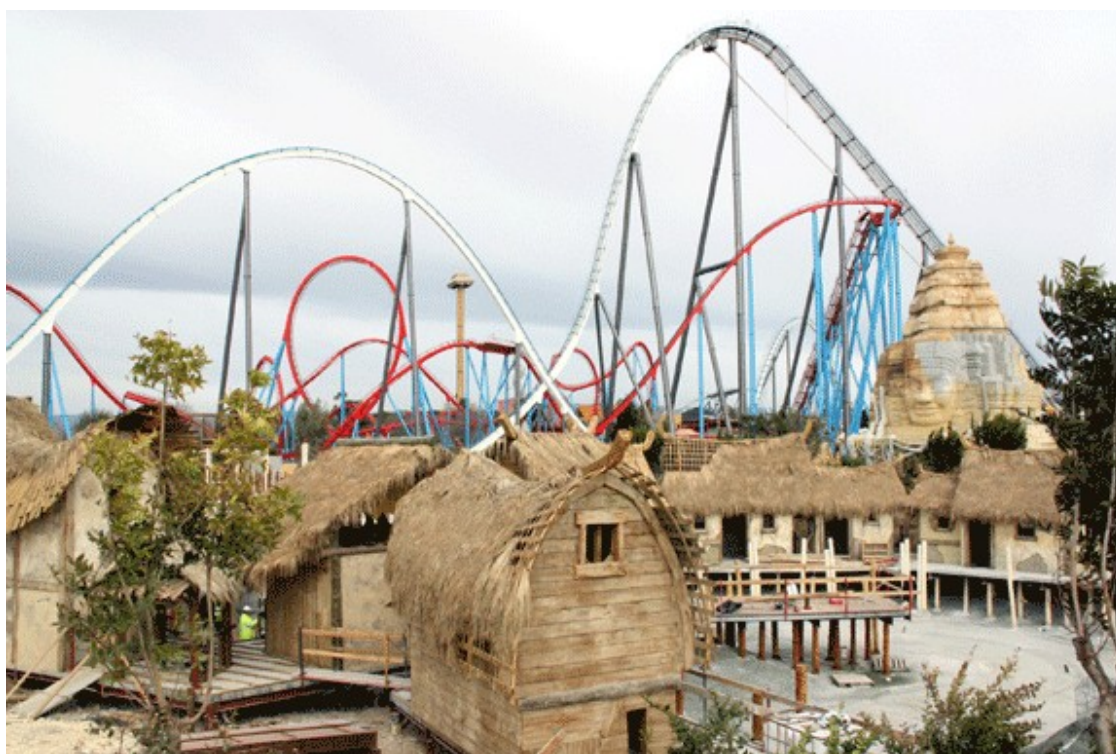
El parc temàtic de PortAventura, en una imatge d'arxiu.