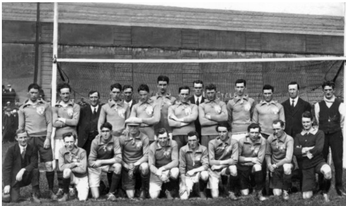
Equip del comtat de Dublín, el Bloody Sunday de 1920

i que van certificar que la policia havia disparat contra els espectadors sense cap mena de provocació prèvia.