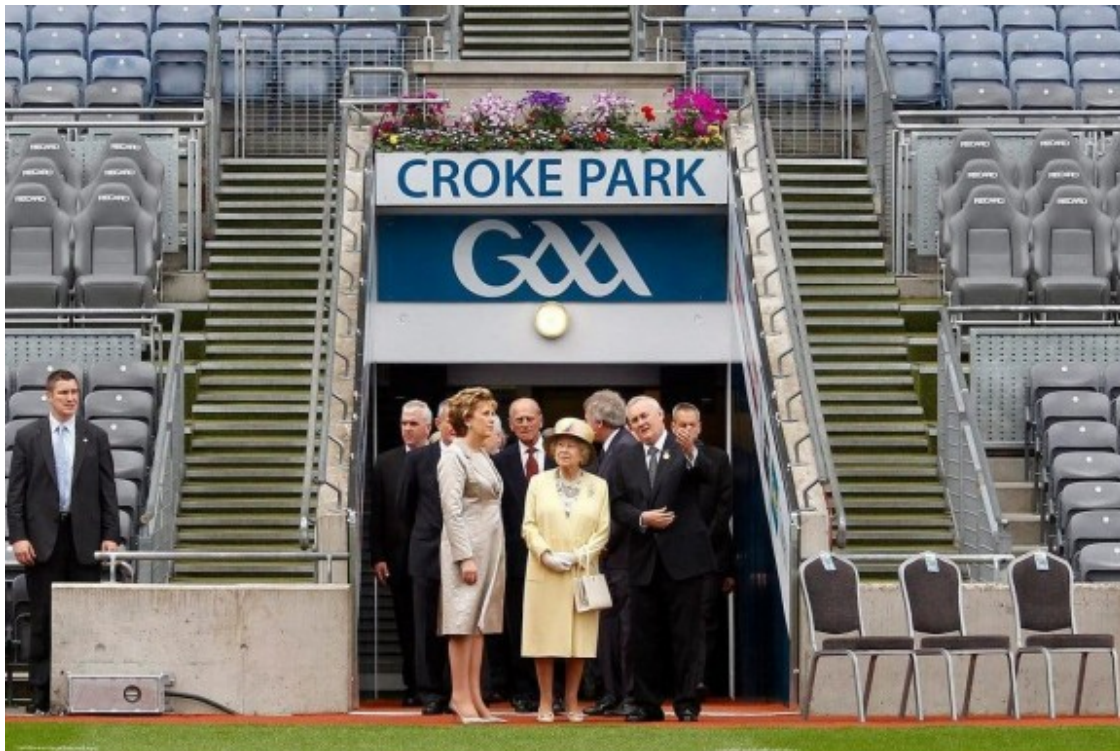
La reina Isabel II durant la seva visita a Croke Park el 2011 on va retre homenatge a les víctimes de la matança de 1920

Tot i que, el maig de 2011, la reina Isabel II va visitar Croke Park i va retre homenatge a les víctimes de la matança, la ferida del Diumenge Sagnant de fa un segle dista molt d'estar tancada. Segurament, només ho estarà quan l'anhel d'una Irlanda unificada i lliure, el mateix que defensaven els homes i les dones irlandeses que van combatre en la guerra per la independència, sigui una realitat.