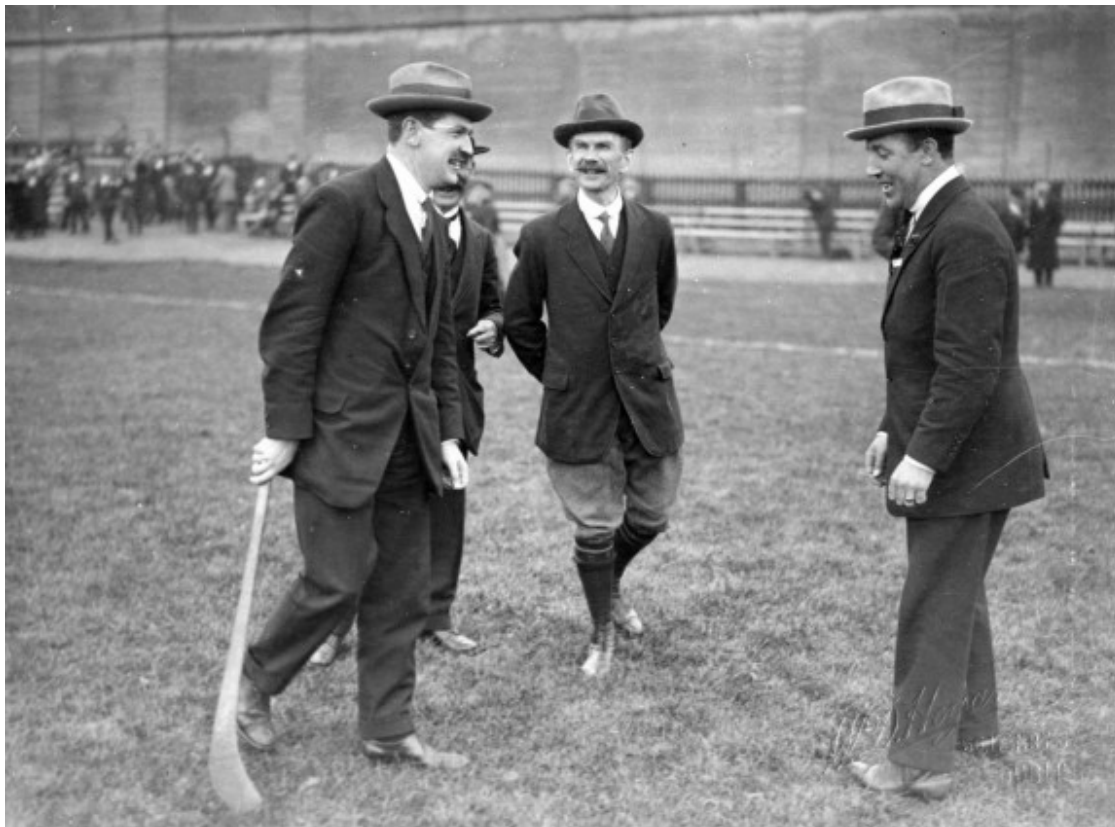
Michael Collins, cap de la intel·ligència de l'IRA, a Croke Park lluint un estic de hurling, un dels principals esports gaèlics, en una imatge de 1921

serveis secrets britànics havien establert a Irlanda. Aquell 21 de novembre de 1920, els homes de Collins, després d'una àrdua tasca per descobrir la identitat dels espies britànics desplaçats a Dublín per combatre l'IRA, van assassinar setze persones i en van ferir cinc més desarticulant la coneguda com a Cairo Gang , un grup d'agents de la intel·ligència britànica que rebien aquest nom de guerra pel seu passat com a espies a Egipte i Palestina durant la Primera Guerra Mundial i pel fet de reunir-se habitualment al Cairo Café, un bar situat al carrer Grafton, al bell mig de Dublín.