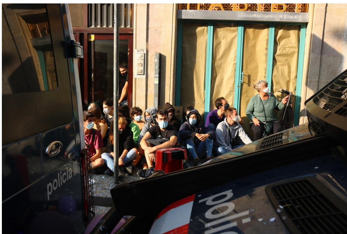
Veïns davant d'un immoble per evitar el desnonament

El col·lectiu fa una crida als partits catalans al Congrés a trencar relacions amb el govern espanyol si no es garanteix el dret a l'habitatge