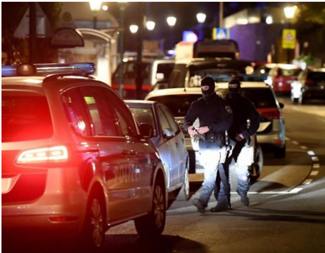
Atemptat mortal a Viena.

? 3324.cat ?? (@3324cat) November 2, 2020 ( https://twitter.com/3324cat/status/1323365260494053377?ref_src=twsrc%5Etfw )