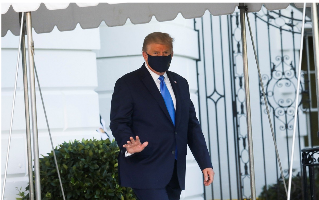
El president dels EUA, Donald Trump.

La dreta alternativa dels EUA revifa amb la pandèmia i manté el suport al candidat republicà