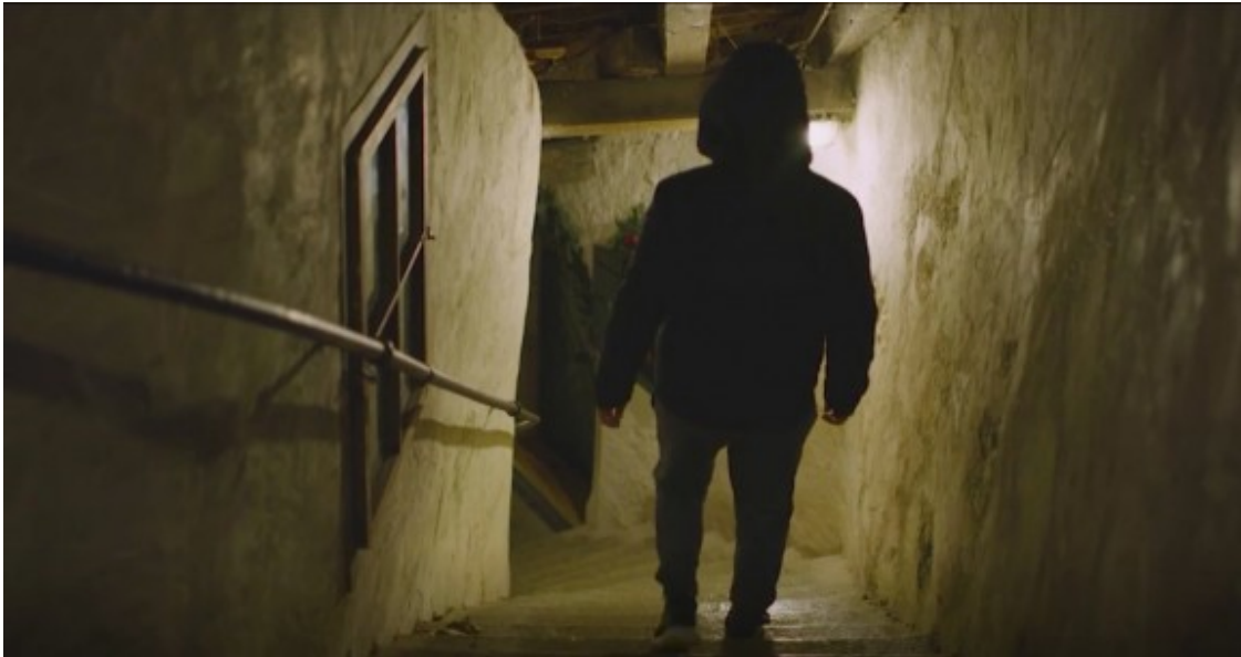
Un fragment de l'anunci del programa «El segrest» de Catalunya Ràdio.

És un relat de no-ficció que revela qui són els culpables des del primer moment, però manté el suspens al voltant de quan i com seran detinguts. Passaran set anys des del segrest fins a la detenció dels autors.