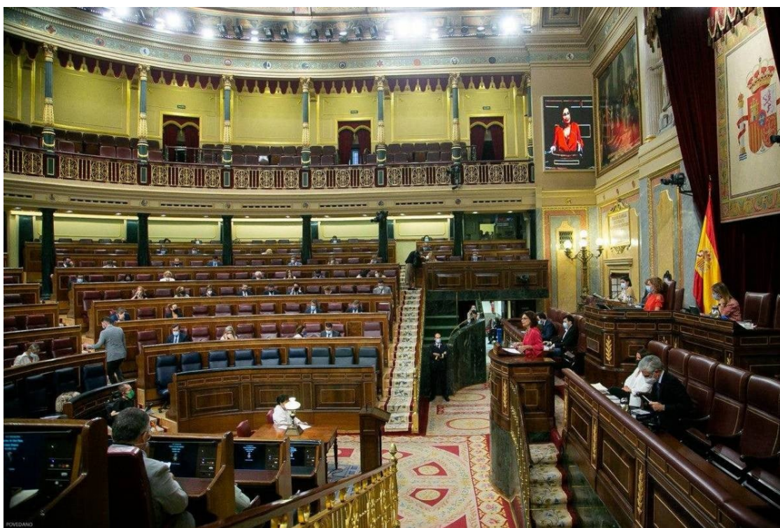
El Congrés, escoltant la ministra d'Hisenda, María Jesús Montero, en un ple recent.

El Congrés deixarà sense efecte les regles fiscals, però no està clar si ara les autonomies hauran d'endeutar-se per aconseguir recursos o si els transferirà el govern espanyol