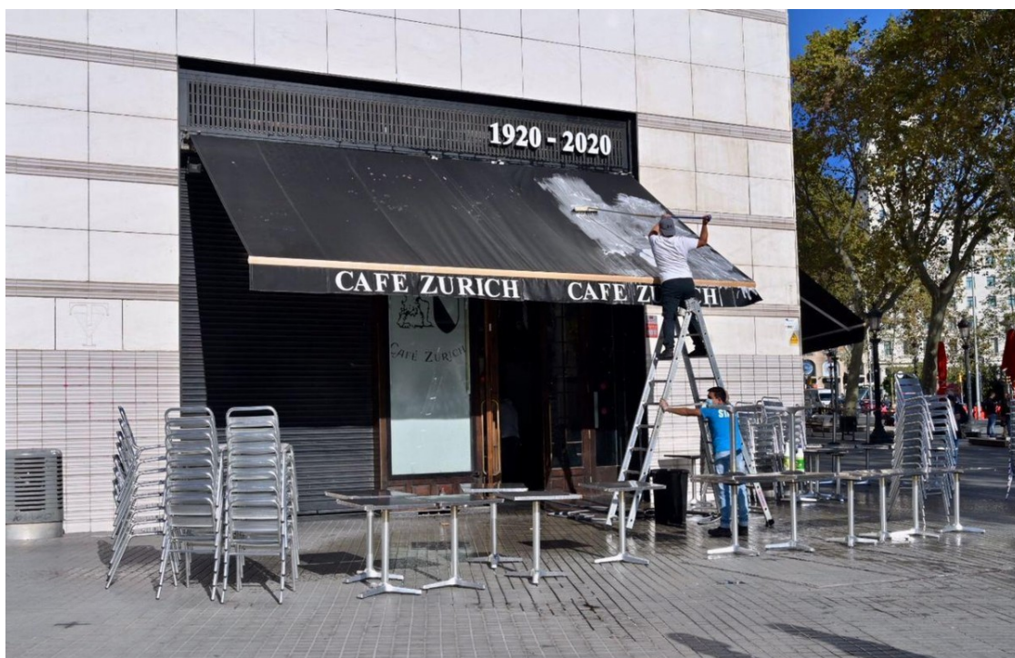
El popular cafè Zurich de Barcelona, tancat | Josep M. Montaner

L'executiu accepta deixar en suspens les mesures sobre reunions de més de sis persones, les classes a la universitat i l'activitat dels centres de culte a l'espera de la resolució judicial, però aplica la resta de limitacions