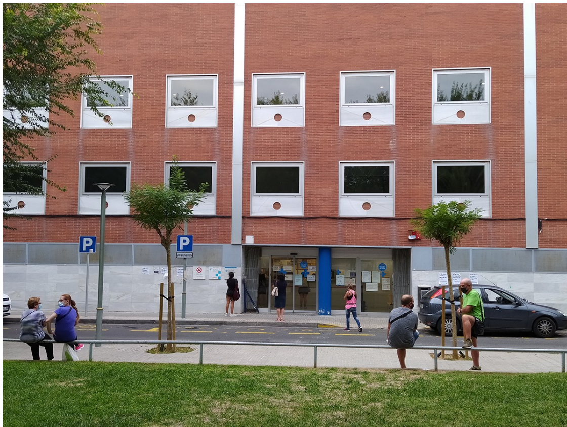
El CAP de Bonavista, al carrer Set.

Les queixes sobre la dificultat per accedir al servei es mantenen tot i els nombrosos anuncis de l'ICS per evitar cues