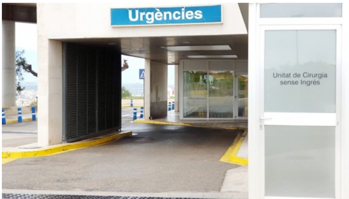
Entrada d'Urgències de l'hospital de Tortosa Verge de la Cinta.

Relacionat amb la formació, els metges residents durant els anys de MIR tenen dret a rotar per diferents serveis del mateix centre o, fins i tot, durant un màxim de quatre mesos, en altres centres sanitaris, per poder adquirir experiència i coneixements. Això, denuncien, no es compleix, ja que a l'empresa no li compensa continuar pagant un sou mentre el resident ofereix les seves hores a una altra. Pel que fa a les rotacions dins del mateix centre, asseguren que s'han ajornat a causa de la Covid-19 i els han traslladat a molts a les plantes dedicades a atendre pacients amb coronavirus. "No sabem què passarà sobretot a la gent que acaba la seva residència", expliquen.