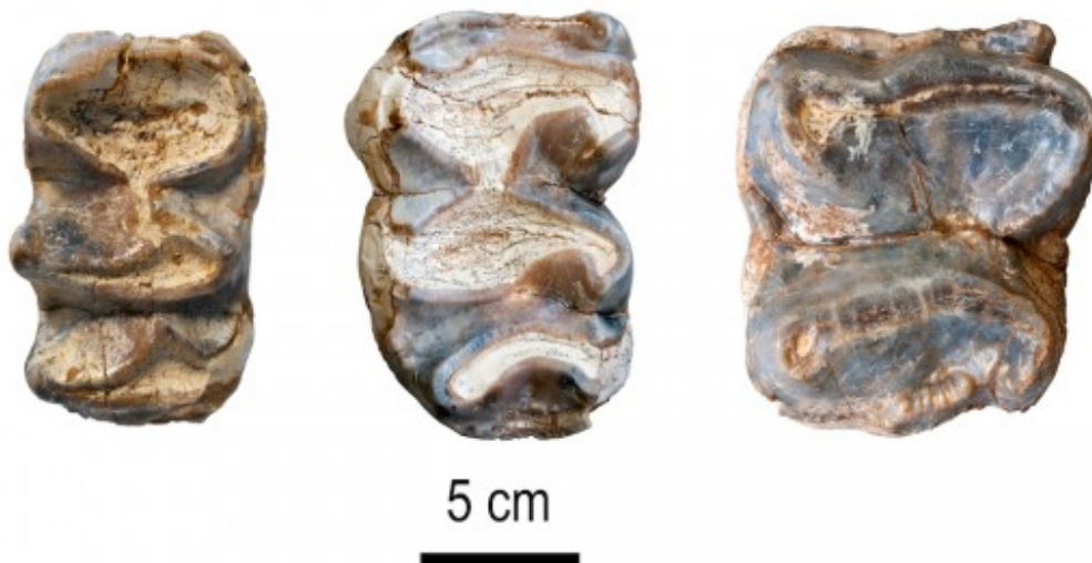
Algunes de les dents fòssils analitzades en l'estudi

Les dents d'aquesta espècie de dinoteri guarden més similituds amb les dels tapirs, que no pas amb les dels elefants: les molars tenen dues o tres crestes transversals. Els dinoteris es caracteritzaven per tenir defenses -el que popularment anomenem "ullals" però en realitat són dents incisives- que els sortien de la mandíbula, i no del maxil·lar com als elefants, així com les potes i el coll més llargs que aquests.