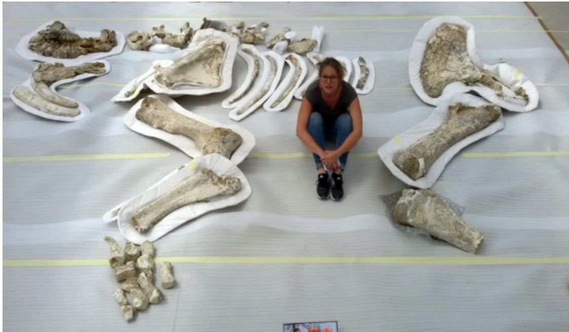
Esquelet parcial de Deinotherium giganteum excavat al jaciment de Can Roqueta, a Sabadell