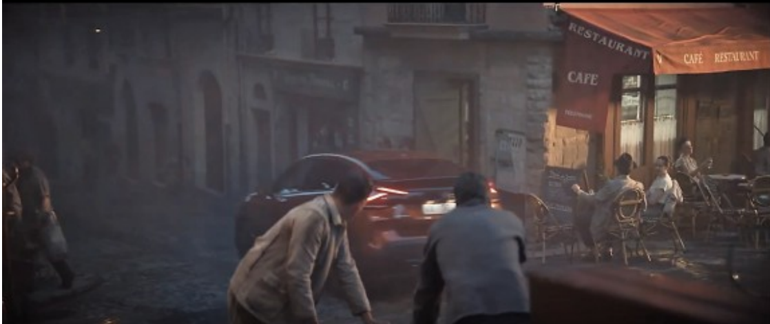
A la dreta veiem La TasKeta de la Núria, convertida en un cafè restaurant.

NOWY C4 I NOWY Ę-C4 - 100% ĘLECTRIC: HAPPY DAY