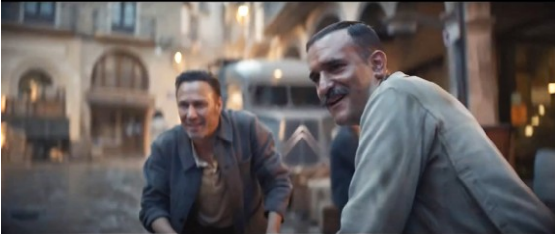
Al fons, amb un cotxe d'època, les arcades de la plaça i la pastisseria Massana.

NOWY C4 I NOWY Ę-C4 - 100% ĘLECTRIC: HAPPY DAY