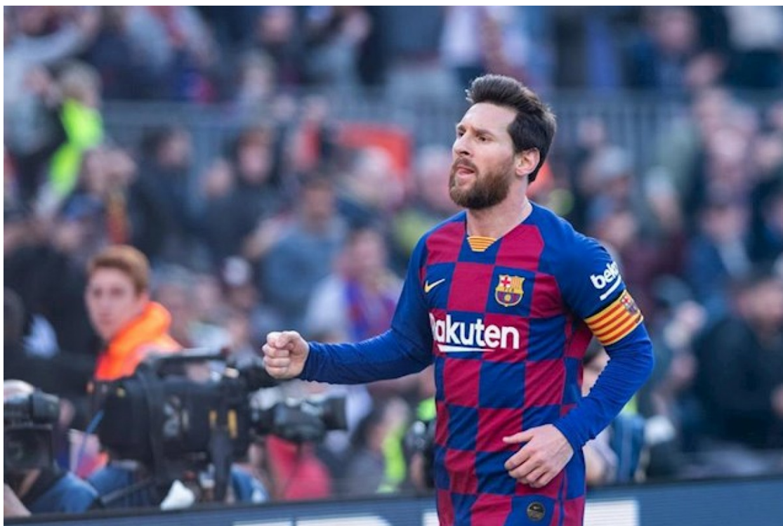
Messi, celebrant un gol aquesta temporada

El capità del Barça manté que el contracte diu que pot abandonar el club a cost zero després de la temporada 2019/20