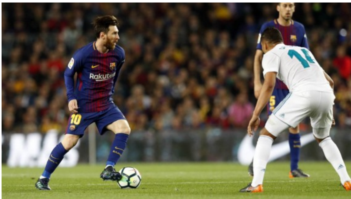
Leo Messi, en un moment del clàssic.