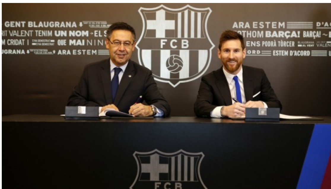
El president del Barça i Messi signant el nou contracte

3. Encara resten mesos per les eleccions i queden noms per aparèixer. Alguns potser no arriben al final de la cursa, i altres que poden aparèixer a última hora, històricament sempre ha passat. Em fa la sensació que qualsevol que tingui una idea, que hi hagi pensat, que tingui noms i hagi intentat veure la formulació de reiniciar el Barça, ja serà millor que el que hi ha actualment. Ara ja ningú té una idea, intenten sobreviure. Qualsevol que arribi portarà aire fresc. De moment, no sé si hi haurà candidatura continuista: ho veig difícil, sobretot que tinguin opcions, perquè s'han desgastat. No ajuden els sis anys de mandat.