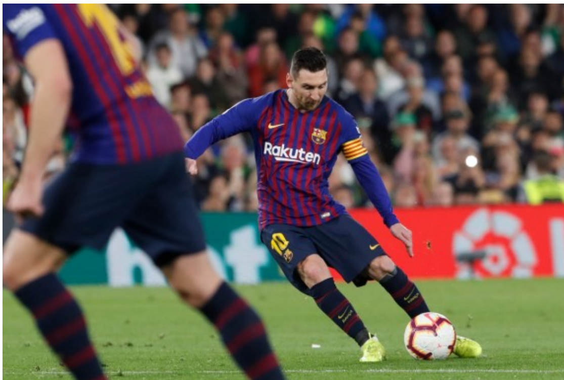
Messi, xutant la falta del primer gol