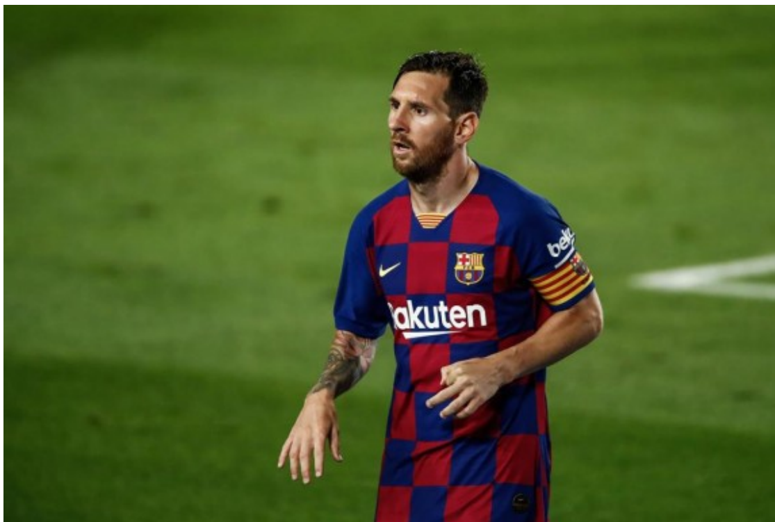
Leo Messi, al partit d'ahir contra l'Osasuna