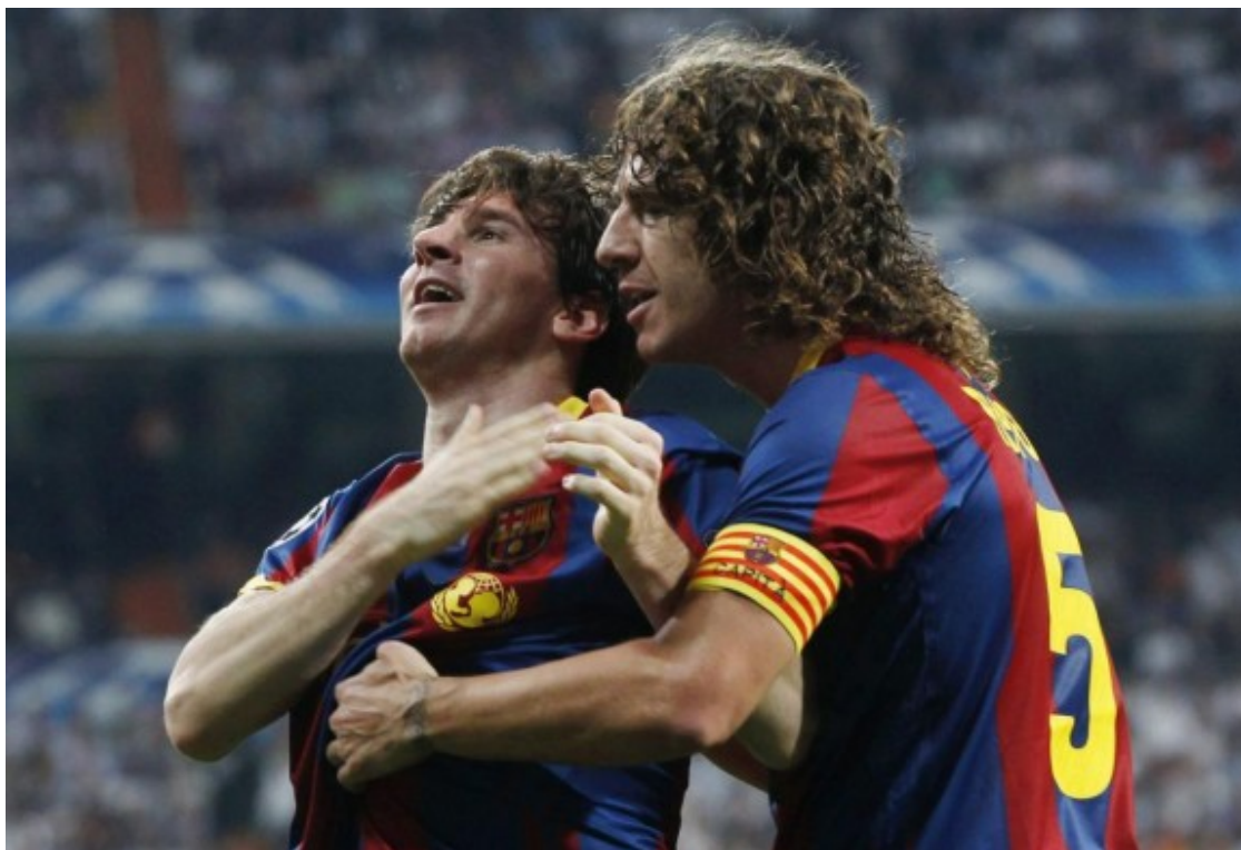
Messi i Puyol, celebrant un gol.