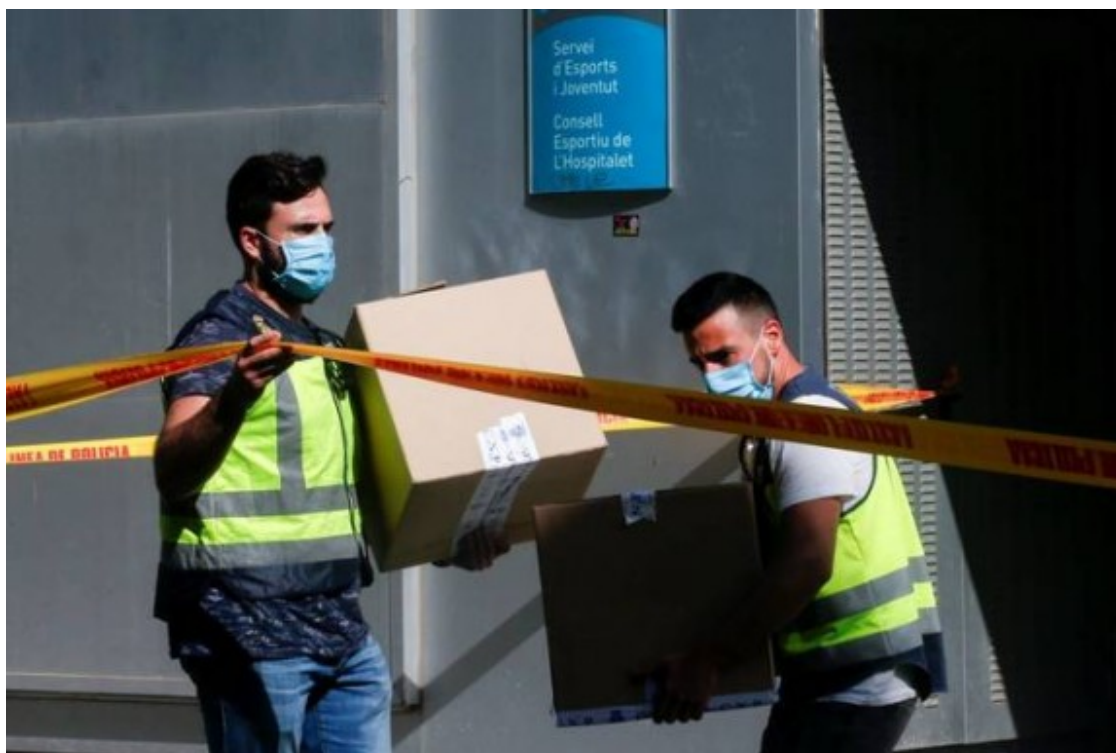
L'operació policial al Consell Esportiu de l'Hospitalet, a principis de juny.

A nivell polític, ERC, que és la principal força de l'oposició, va exigir en el ple de juny una comissió d'investigació municipal sobre el cas i que l'Ajuntament es personés com a acusació, en cas que el judici tirés endavant, però la petició va ser rebutjada, ja que, tot i que tant el regidor denunciador com els dos investigats van declinar intervenir en el debat i votar, la resta del PSC ho va fer en contra i Ciutadans es va abstenir