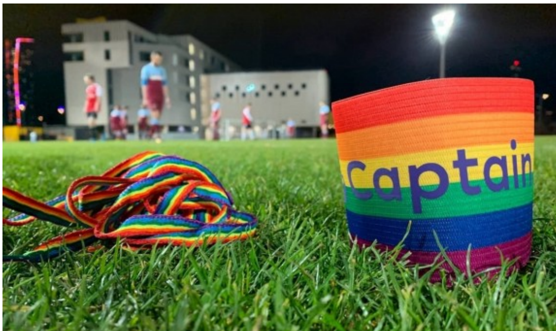
Una imatge promocional de la campanya 'Rainbow Laces' realitzada pel West Ham United londinenc amb els cordons de les botes i el braçalet de capità amb els colors de l'arc de Sant Martí

El debat desfermat arran de l'entrevista al migcampista alemany, alimentat per la proximitat del 28 de juny, la data la que es commemora la revolta contra la ràtzia policial a l'Stonwell Inn, un bar novaiorquès d'ambient gai, que va tenir lloc el 1969, ens serveix per fer memòria i recordar la trista història de Justin Fashanu, el primer futbolista professional que, ara fa tres dècades, va fer pública la seva homosexualitat.