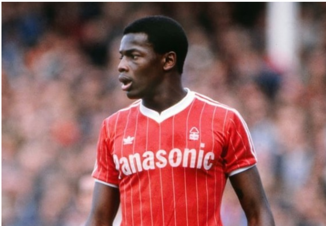
Justin Fashanu vestint la samarreta del Nottingham Forest en una imatge de 1981

El distanciament entre Clough i Fashanu va provocar que l'estada del davanter al Forest només s'allargués durant una temporada. En marxar, l'antiga promesa del Norwich va iniciar una trajectòria de rodamón pel futbol anglès que va dur-lo a defensar les samarretes del Southampton, del Notts County, del Brighton & Hove Albion i, després d'una breu estada a Amèrica on es va recuperar d'una lesió al genoll que amenaçava la seva carrera, del Manchester City, del West Ham i del Leyton Orient.