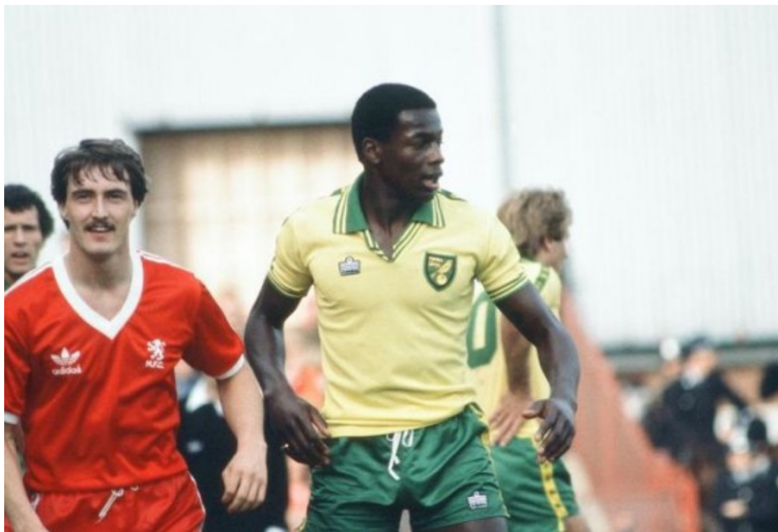
Justin Fashanu durant la temporada del seu debut amb la samarreta del Norwich

Després d'uns prometedors inicis en el món de la boxa, Justin Fashanu es va incorporar, als 14 anys, als equips inferiors del Norwich City, el principal equip del comtat de Norfolk, on va realitzar una meteòrica progressió que va dur-lo, a finals de desembre de 1978, quan tot just tenia 17 anys, a convertir-se en jugador professional i a debutar poc després a la lliga anglesa.