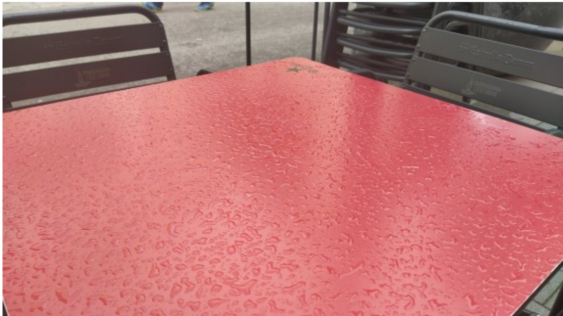
La terrassa d'un bar de Rubí, molla per la pluja

A més, aquestes dues setmanes han coincidit amb molts dies de pluja, cosa que ha fet que la clientela o bé no sortís o bé no s'asseiés a les terrasses, o només a les que han pogut cobrir amb parasols o carpes de plàstic.