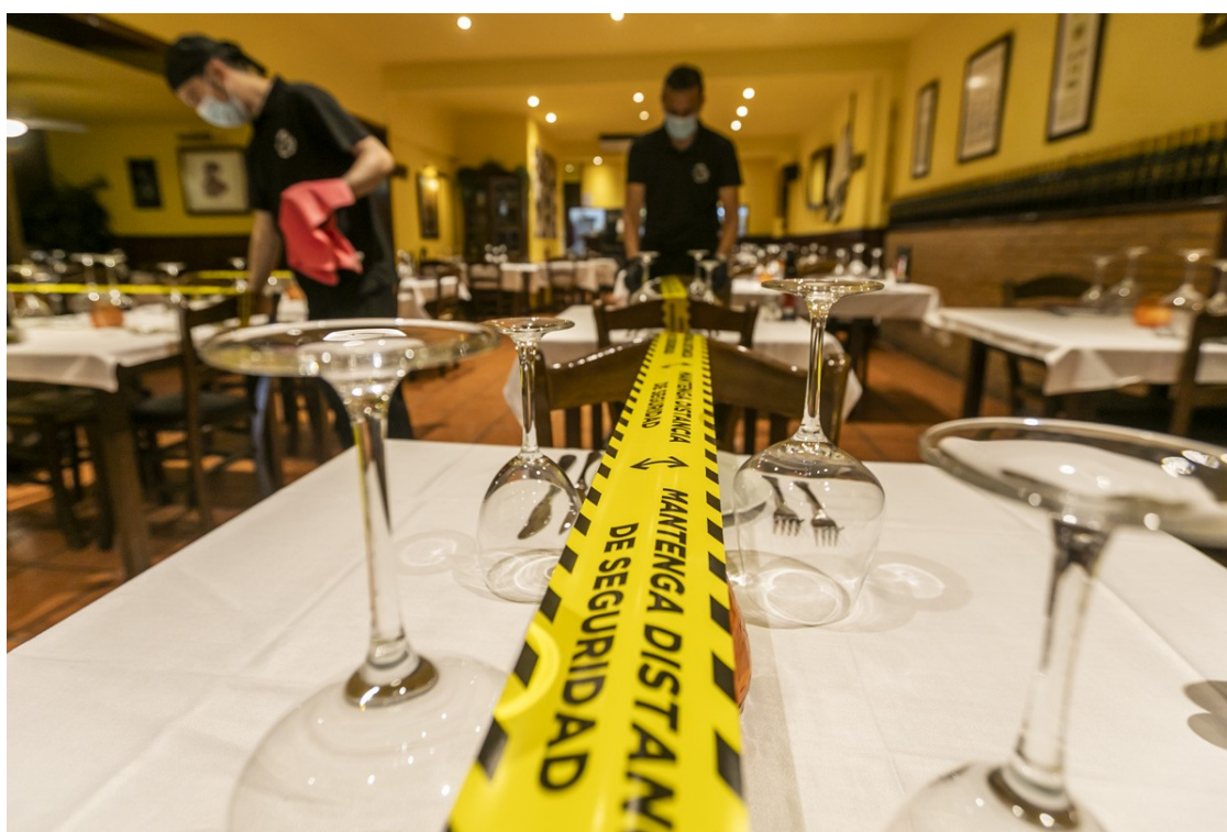
Interior d'un restaurant de Sabadell, en fase 2.

Parlem amb Cesc Castellet, vocal del Gremi d'Hostaleria de Terrassa per analitzar les dues primeres setmanes de fase 1 i les expectatives amb l'arribada de la fase 2, que permet obrir l'interior dels locals