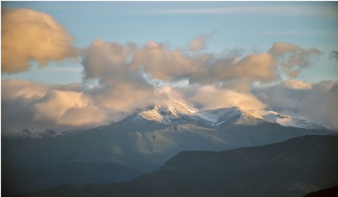
Enfarinada al Pirineu i boires a l'albada