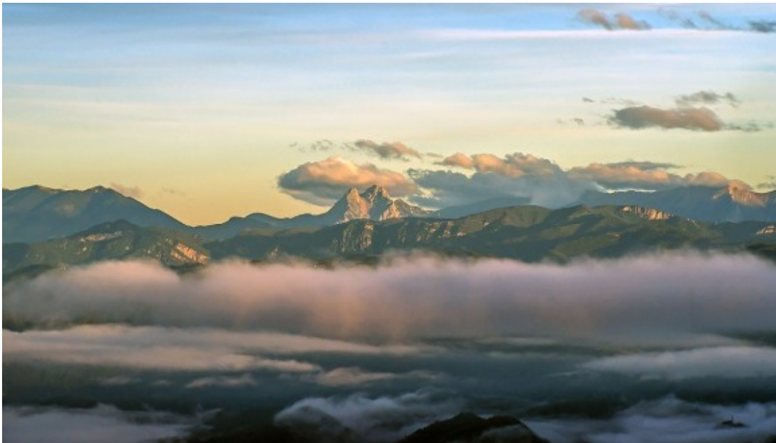
Enfarinada al Pirineu i boires a l'albada