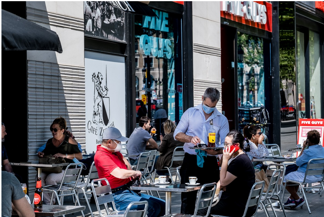
Una terrassa durant la fase 1 a Barcelona | Adrià Costa

El Departament de Salut sol·licita també el canvi a fase 3 de Terres de l'Ebre, Camp de Tarragona i Alt Pirineu-Aran i que Lleida avanci a fase 2 a partir del 8 de juny