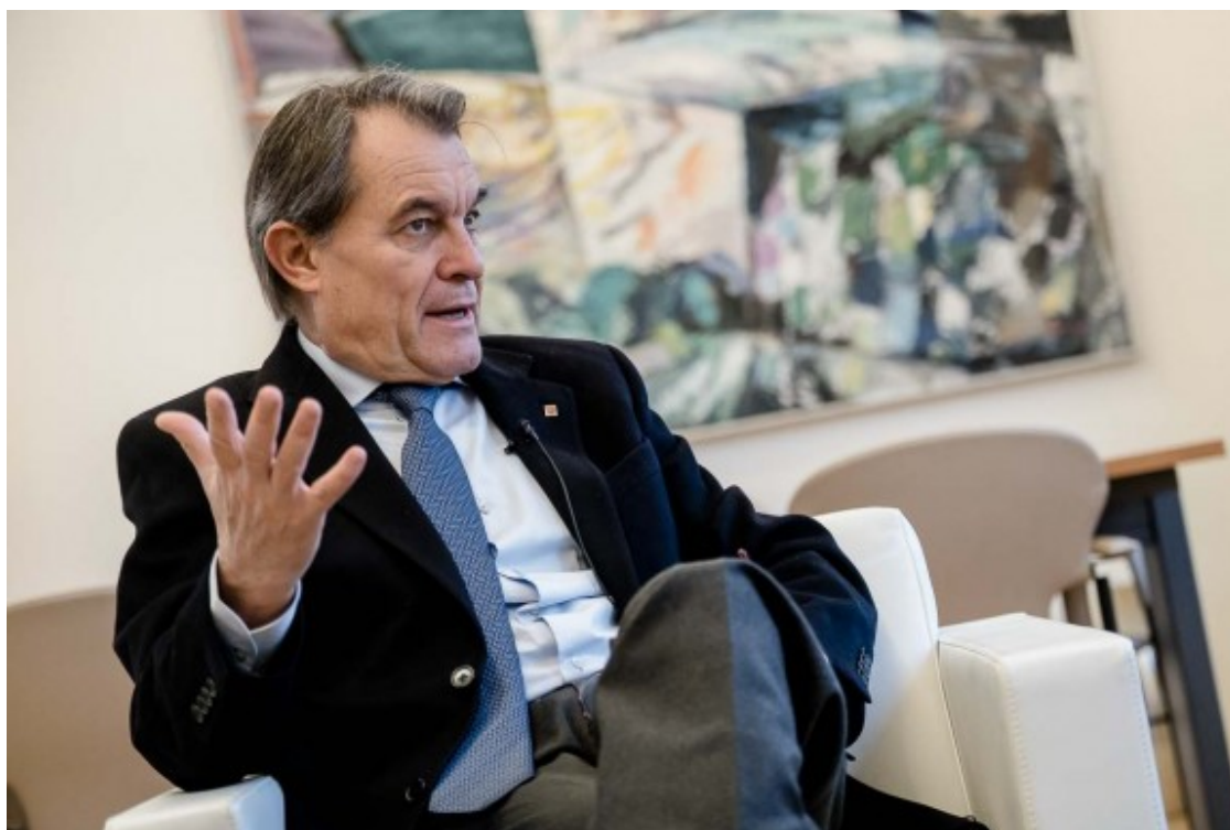
L'expresident va patir una inhabilitació de dos anys pel 9-N, ja acabada.

- M'és indiferent. La decisió l'ha de prendre ell i ningú, i molt menys jo, com a expresident, he de donar la sensació de fer una recomanació en un sentit o en un altre sobre la data electoral. Personalment, m'és indiferent: quan el president Torra cregui.