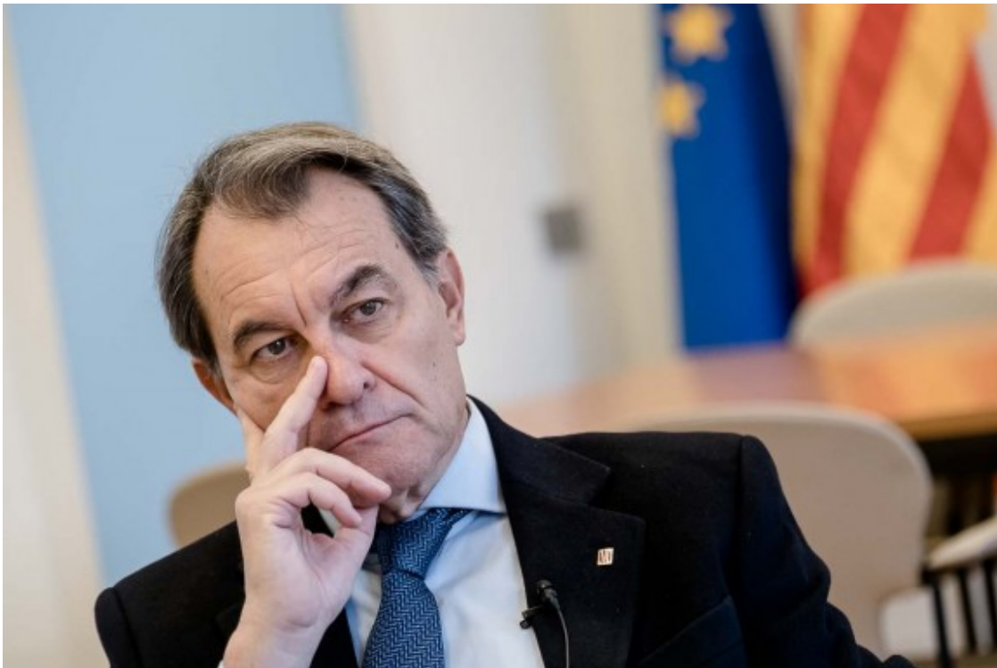
Mas descarta tornar a primera fila, però s'obre a "escollir" propostes.

- No necessàriament. Pot ser, evidentment, perquè qualsevol conseller o consellera respondria a aquest perfil. Però no necessàriament.