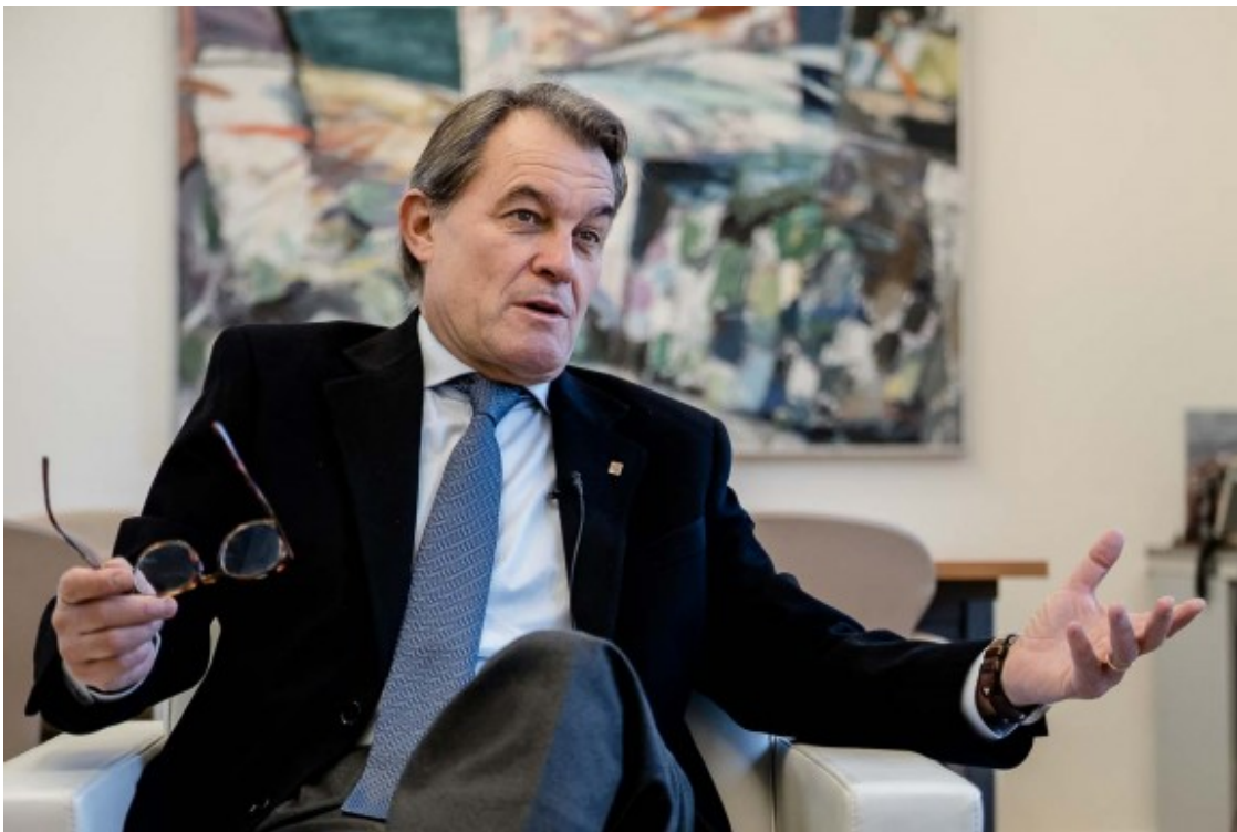
Mas, en un despatx del Palau Robert, on hi ha la seva oficina com a expresident.

- No em postularé, segur que no. Si algú em fa alguna reflexió o em demana alguna cosa, escoltaré. Però segur que no em postularé per tenir cap posició a cap llista ni a cap direcció de cap partit. No vull semblar un desmenjat ni un desmotivats. Durant molts anys em vaig postular, no sóc un polític que no ha tingut ambició ni ha lluitat per estar al davant de tot, exactament al revés. Però la vida té etapes i les trajectòries polítiques, també. Ara em veig en una etapa diferent. No és un problema de desmotivació, ni de desconfiança, ni de sentir-me allunyat: es tracta de voler fer un paper que fins ara no he fet i que és el que m'estimula més.