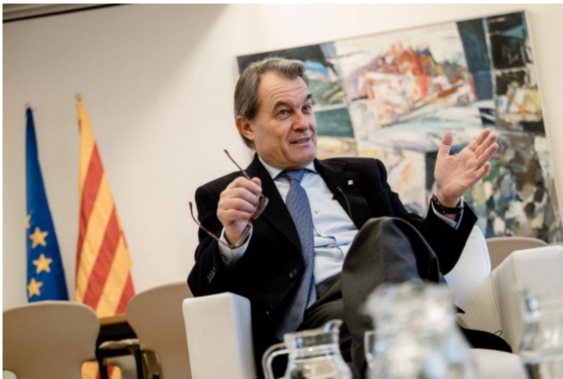
El dirigent sobiranista va triar Carles Puigdemont com a successor el 2016.

- El 2012 vostè decideix posar en marxa el procés o pujar-hi al carro, hi ha interpretacions per tots els gustos. Ha valgut la pena?