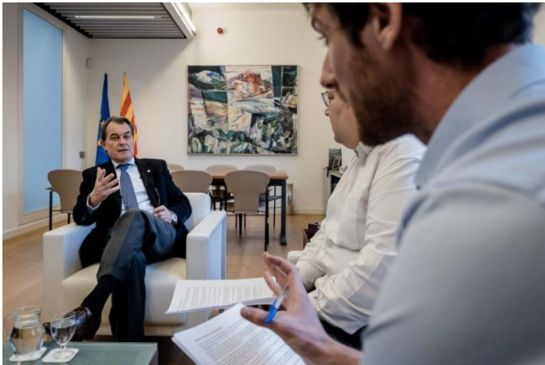
L'exlíder de CDC i del PDECat respon el subdirector i el cap de Política de NacióDigital.

- Precisament en el procés del referèndum de l'1-O, com vostè va viure molt de prop, una de les queixes que hi havia al Govern era sobre l'estat major, que prenia decisions i no retia comptes perquè estava format per gent de fora de l'executiu.