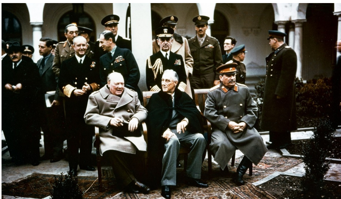
W.Churchill, F.Roosevelt i I.Stalin, a la Conferència de Ialta

Stalin, Churchill i Roosevelt van decidir els últims atacs conjunts de la Segona Guerra Mundial, el repartiment geopolític del planeta en conflicte i la situació mundial en un palau tzarista de Crimea