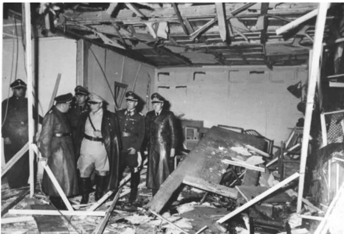
Estat en el qual va quedar el Cau del Llop, la sala de conferències del quarter nazi de Rastenburg on va tenir lloc l'atemptat fallit contra Adolf Hitler

Tot i que els partits que es van jugar a Auschwitz no han estat documentats al nivell que ho van ser els de Terezín, per a la història han quedat algunes anècdotes, com el funest derbi que havia de disputar-se a finals de juliol de 1944 entre un combinat del camp d'Auschwitz I i un altre del de Birkenau (Auschwitz II) i que, malgrat els esforços que s'havien dedicat a la seva preparació, va haver de ser suspès arran de l'atemptat fallit contra la vida de Hitler que, en el marc de l'operació Valquíria, els seus opositors al si de l'exèrcit alemany van realitzar al quarter general nazi de Rastenburg, situat també en territori polonès.