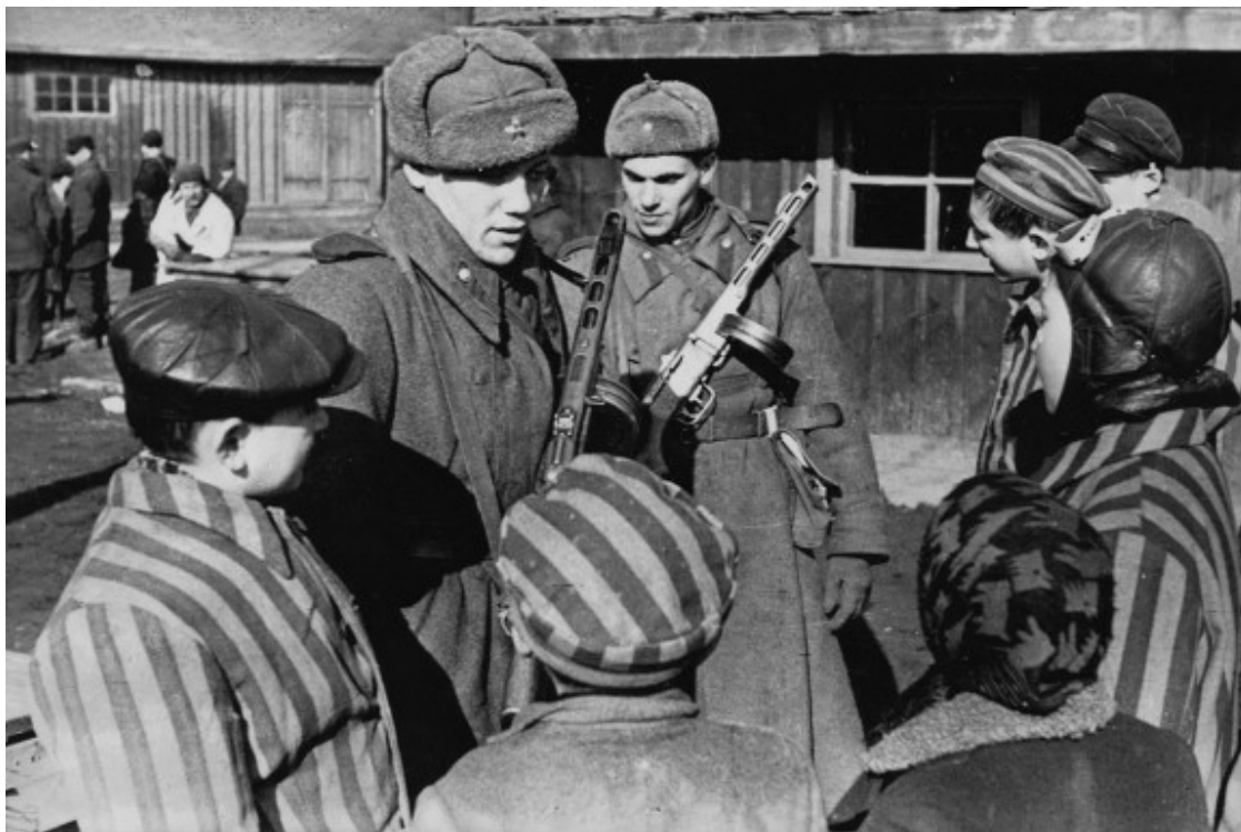
Soldats de l'Exèrcit Roig Soviètic que van participar en l'alliberament del camp d'Auschwitz conversen amb un grup de joves presoners

Amb els detalls escabrosos de la política d'extermini nazi es van descobrir també les petites històries que havien marcat la vida dels presoners i les presoneres en aquests camps de la mort. Entre ells, que el futbol s'havia convertit en una pràctica habitual en aquests centres. Una circumstància que, com agrada recordar a diversos dels supervivents que van practicar aquest esport en algun dels diversos camps de concentració, no ens ha de fer oblidar que la vida en aquests espais era un autèntic infern i que si bé la pràctica esportiva permetia l'evasió temporal de la tragèdia que s'hi vivia, és precisament aquest drama el que ha de ser primordialment recordat.