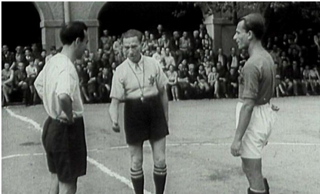
Inici d'un dels partits de la lliga del camp de Terezín amb l'àrbitre lluint una estrella de David al pit

Des de 1942, a Terezín s'hi va disputar un campionat de lliga que enfrontava diversos equips de presoners al qual ràpidament es van afegir noves competicions com ara un torneig de copa, una segona divisió, una supercopa i, fins i tot, una lliga juvenil. La singularitat de Terezín no rau només en el fet que s'hi disputaven competicions perfectament estructurades sinó en què els seus resultats han quedat documentats, una circumstància que ens permet saber que les lligues d'aquest camp nazi van ser guanyades per l'equip dels mainaders (en dues ocasions), pel dels responsables de la roba, pel dels cuiners, pel dels carnissers, o per l'Sparta, un combinat batejat a imatge de l'històric club de la capital txeca.