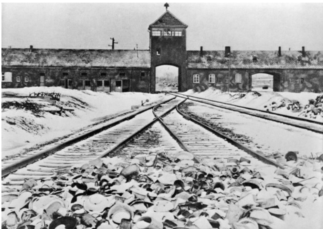
Entrada al camp de concentració de Birkenau, conegut com a Auschwitz II

A Birkenau, s'hi va construir també un nou camp de futbol , situat en una zona molt propera al tercer crematori, que tenia com a responsable de manteniment a un presoner, que vetllava de manera periòdica per l'estat de la gespa i per l'anivellament del terreny. Aquest nou estadi va acollir múltiples partits entre diferents equips formats per presoners dels camps que, sovint, jugaven mentre, a escassos metres, els seus companys eren exterminats en una situació que reflectia com, en aquell tètric indret, la vida convivia de forma permanent amb la mort.