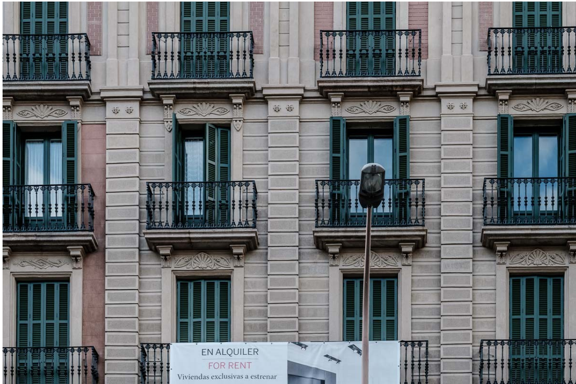
Pisos en lloguer al centre de Barcelona. | Adrià Costa

«Els propietaris poden fer els augments dels preus dels lloguers que els doni la gana. 'Preu de mercat', diuen. Fabulós. Com tothom sap, el mercat sempre té raó»