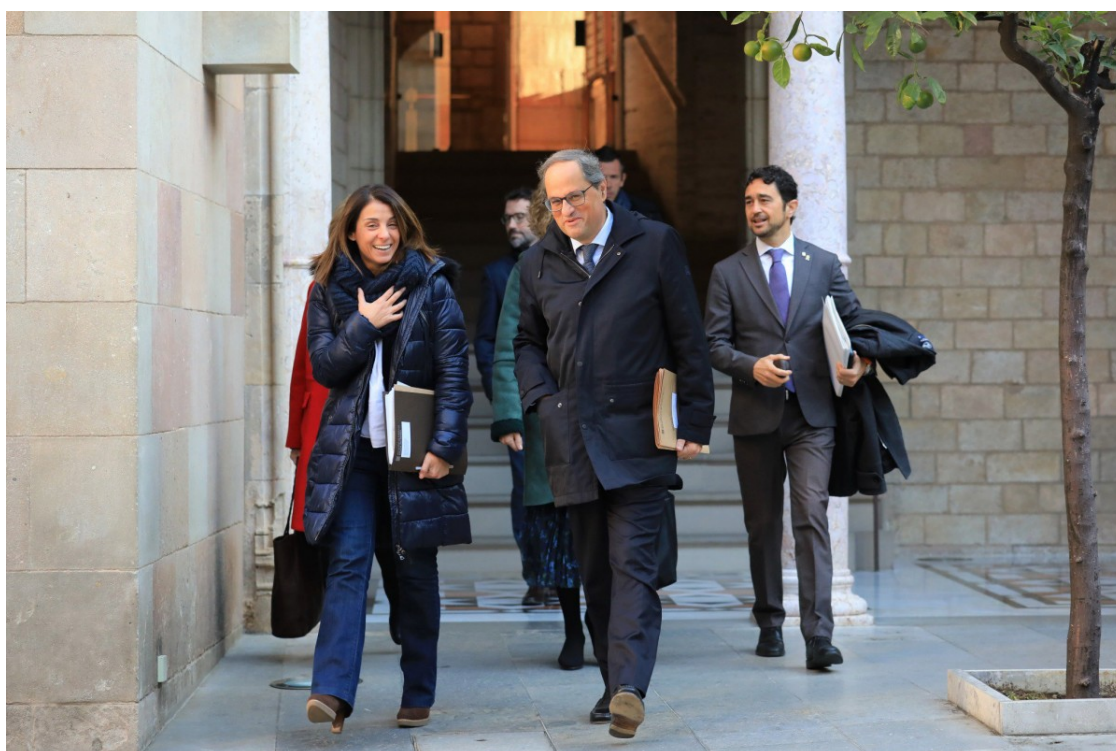
Quim Torra, en una reunió de Govern

El tribunal electoral ordena retirar l'acta de diputat al president de la Generalitat sense esperar que el Suprem es pronunciï sobre la sentència del TSJC