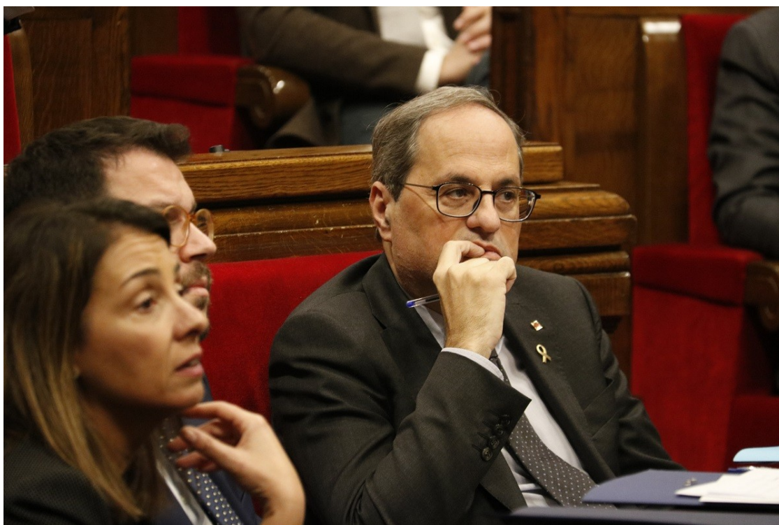
El president de la Generalitat, Quim Torra

La Junta Electoral debat el 3 de gener recursos del PP i Ciutadans per apartar-lo sense esperar al Suprem, fet que podria posar en crisi l'executiu català i impactaria en la investidura