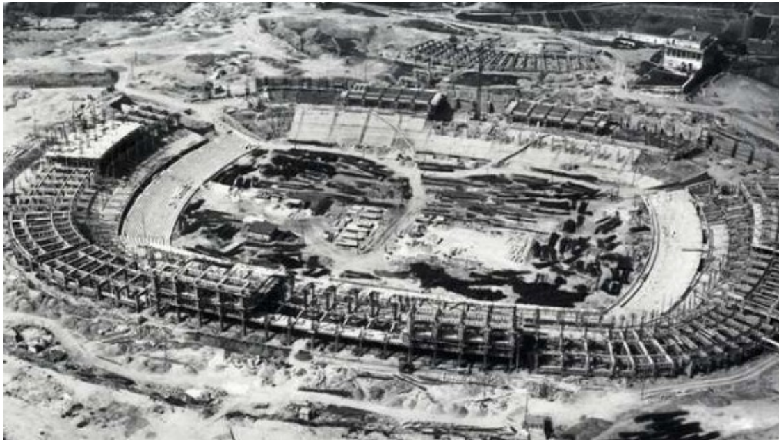
Les obres de construcció del Camp Nou, que es va inaugurar el 1957.

Entre les moltes decisions arbitràries del primer franquisme a can Barça va haver el canvi de nom del club. A les autoritats del nou Estat els molestava això de Futbol Club Barcelona, que veien com una influència britànica i, per tant, estrangera, i es va imposar el Club de Futbol Barcelona, fins que anys després es va recuperar el nom original. L'escut del club també va ser modificat, reduint-se les quatre barres a dues durant uns anys. Després de Piñeyro va venir la presidència d'Agustí Montal, una de les més brillants de l'etapa franquista, i el club va encaminar-se cap a una relativa normalització. Amb ell arribaria un gran mite: Kubala. Més tard arribaria el projecte d'un nou estadi, amb les obres de construcció del Nou Camp, que es va inaugurar el 1957.