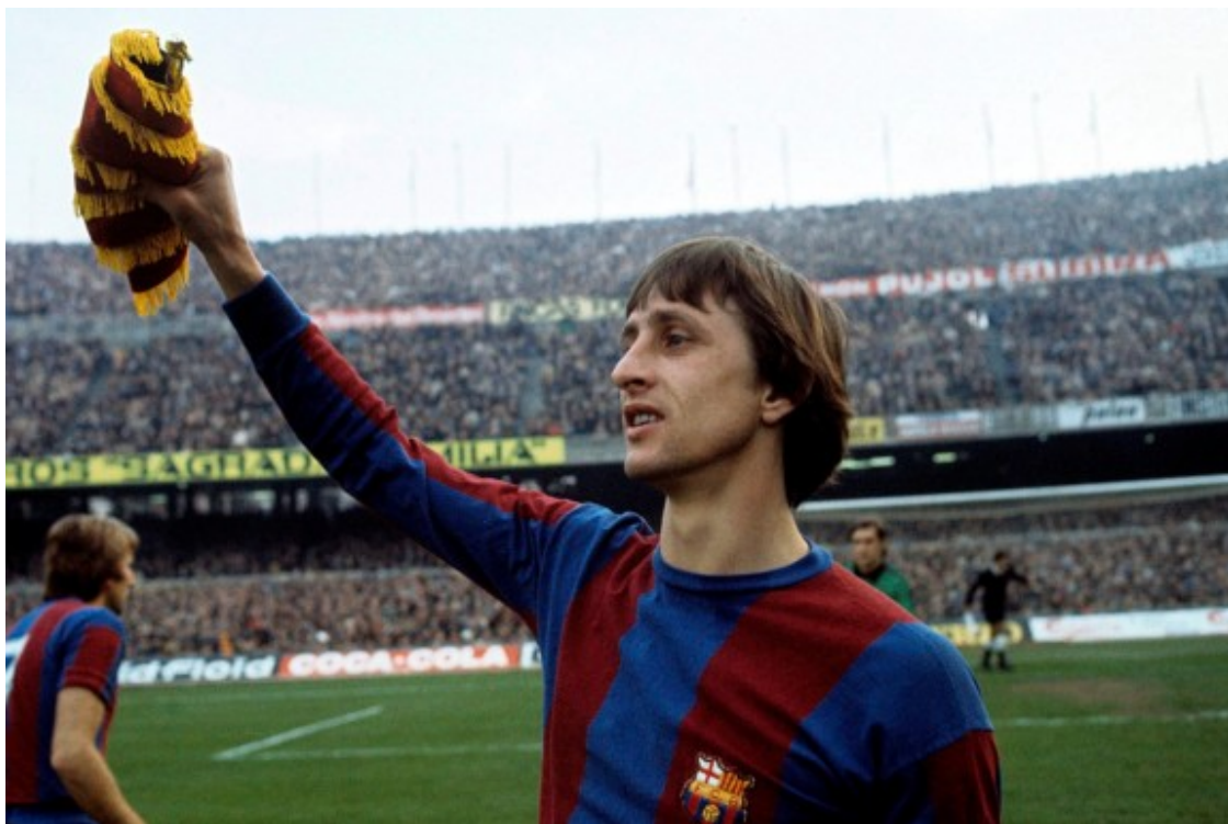
Johan Cruyff, en un partit amb el Barça