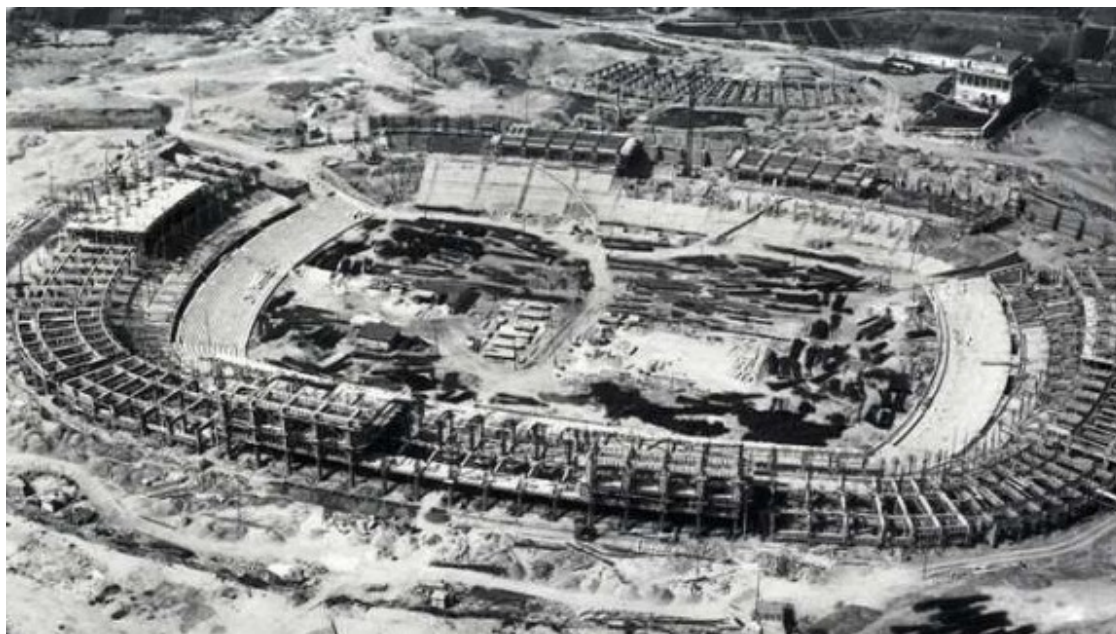
Les obres de construcció del Camp Nou, que es va inaugurar el 1957.

Entre les moltes decisions arbitràries del primer franquisme a can Barça va haver el canvi de nom del club. A les autoritats del nou Estat els molestava això de Futbol Club Barcelona, que veien com una influència britànica i, per tant, estrangera, i es va imposar el Club de Futbol Barcelona, fins que anys després es va recuperar el nom original. L'escut del club també va ser modificat, reduint-se les quatre barres a dues durant uns anys. Després de Piñeyro va venir la presidència d'Agustí Montal, una de les més brillants de l'etapa franquista, i el club va encaminar-se cap a una relativa normalització. Amb ell arribaria un gran mite: Kubala. Més tard arribaria el projecte d'un nou estadi, amb les obres de construcció del Nou Camp, que es va inaugurar el 1957.