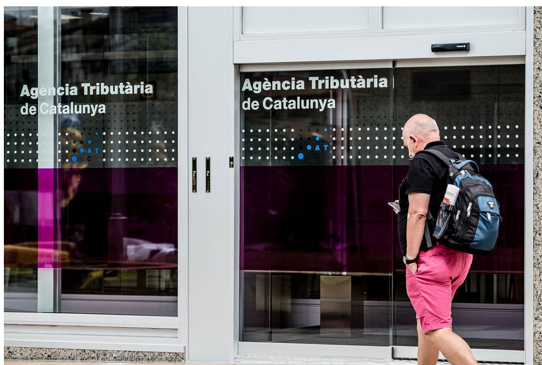
Oficina de l'Agència Tributària de Catalunya. | Adrià Costa

La Generalitat subratlla que la voluntat era fer aflorar actius no productius de les empreses i ja ha emprès mesures per analitzar quins béns segueixen ocults