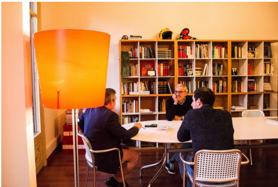
L'advocat de Forn i Melero, al seu despatx aquest dijous a la tarda.